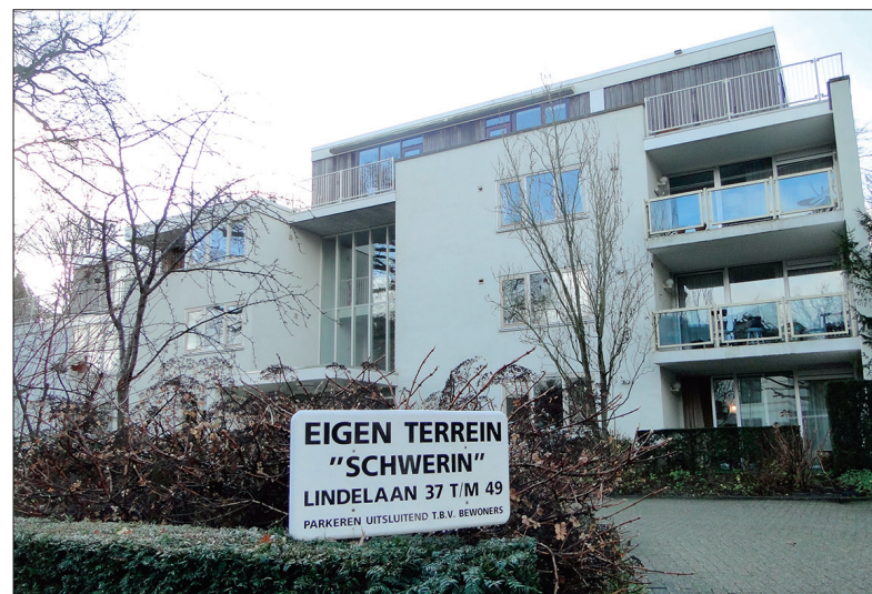
Schwerin in 2014.