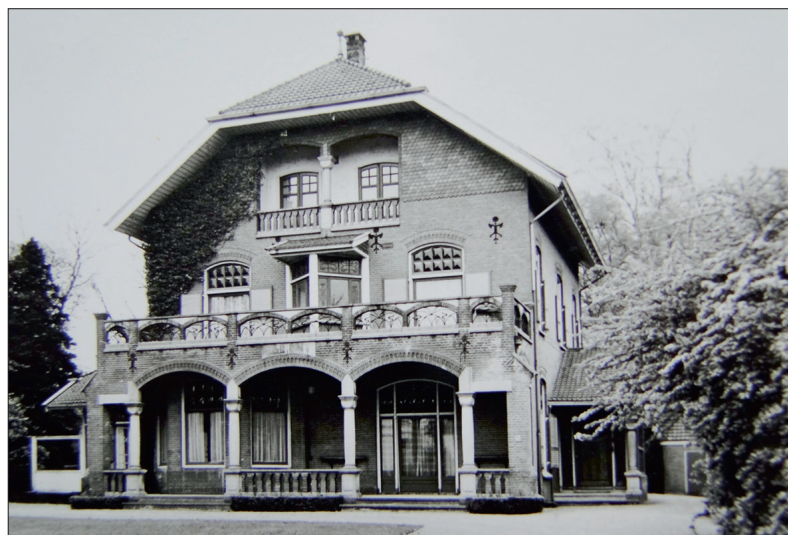
De Schwerin Villa in 1980.

De bouw eind negentiende eeuw, de bebouwing door een groot gezin van stand, het verval en de sloop van de villa en vervolgens het hergebruik van het perceel voor appartementen, weerspiegelt een historische ontwikkeling: de standensamenleving van vóór de Eerste Wereldoorlog is geleidelijk overgegaan naar een egalitaire samenleving, met kleine gezinnen en zonder huishoudelijk personeel.