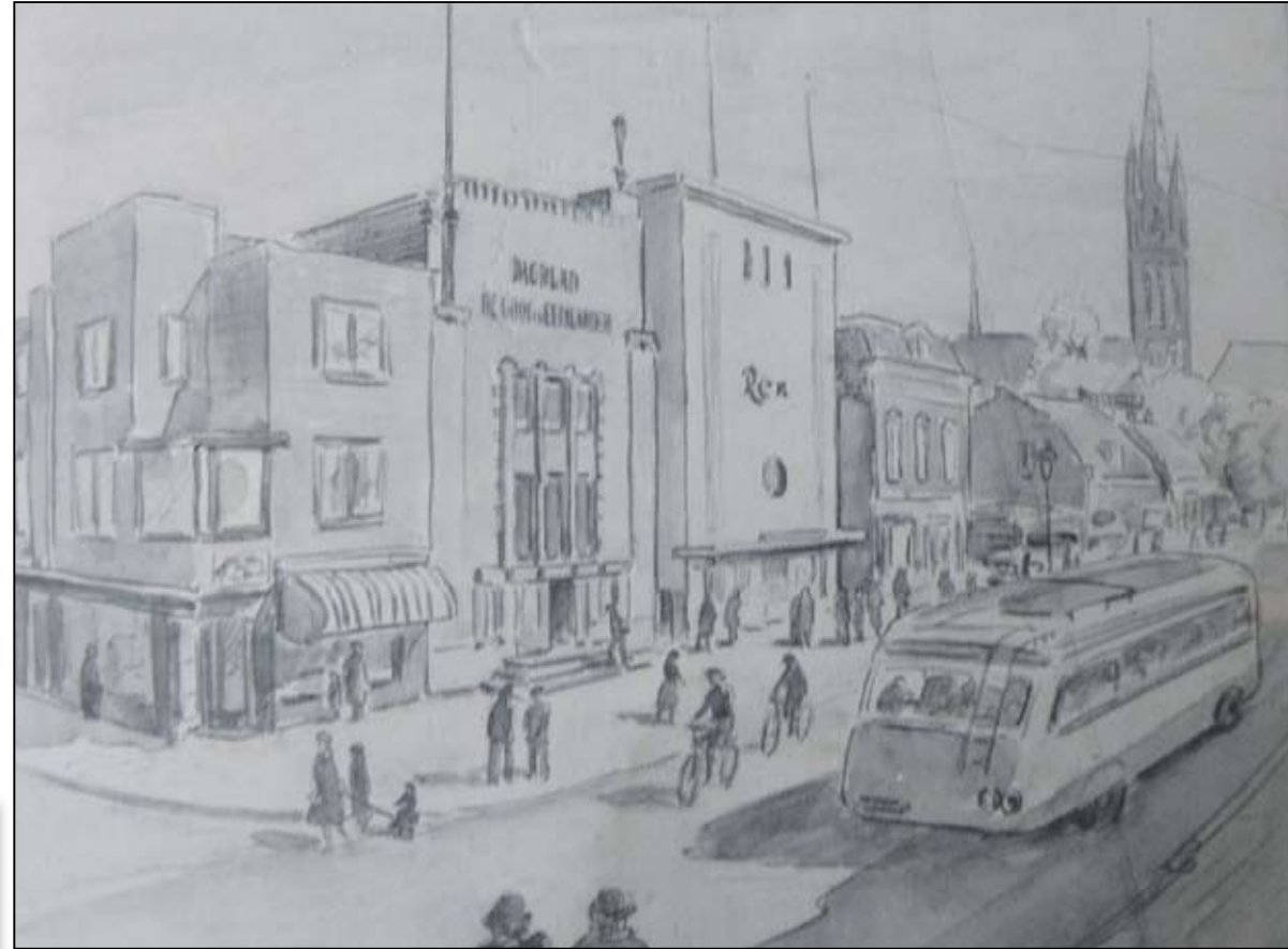
Het Hoofdkantoor aan de Groest (aquarel van J. Sluijters jr.)

1946. Enkele medewerkers kregen voor enige maanden tot 2 jaar een beroepsverbod opgelegd. De directeur mocht 5 jaar zijn taken niet uitoefenen. De man die De Vrije Gooi- en Eemlander zou gaan runnen werd nu de nieuwe directeur van de G&E. De herverschijning liep echter nog enige maanden vertraging op. Gooische Klanken was de concurrent en ze moesten beide van dezelfde gebouwen, materialen en mensen gebruik maken. De G&E was na herverschijning succesvol gelet op het aantal abonnees en de advertentie-inkomsten. De zetterij en drukkerij werkte Gooische Klanken tegen waar het kon. Gooische Klanken ging (niet alleen daardoor) failliet.