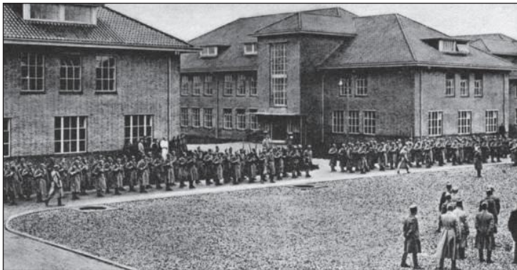
8e Depotbataljon betreft de kazerne

In de tweede helft van de negentiende eeuw waren in Engeland het ziekteverzuim en de sterftcijfers onder militairen zo hoog dat een onderzoek werd ingesteld naar de oorzaken. Geconstateerd werd dat grote en massale gebouwen met weinig licht en lucht een slechte invloed hebben op de gezondheid van de militairen. Kleinere gebouwen in een ruime omgeving zouden een oplossing bieden en zo ontstond de paviljoenbouw. Het duurde echter nog een halve eeuw voordat dit idee in ons land navolging vond. Een voorbeeld was de Kromhoutkazerne aan de rand van Utrecht (1910-1912). Twee genieofficieren, kapitein A.E.