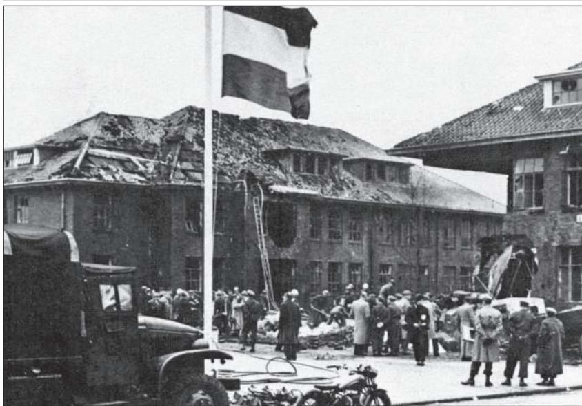
(boven) Vernield legerings- gebouw na het geallieerde bombar- dement op 28 november 1944