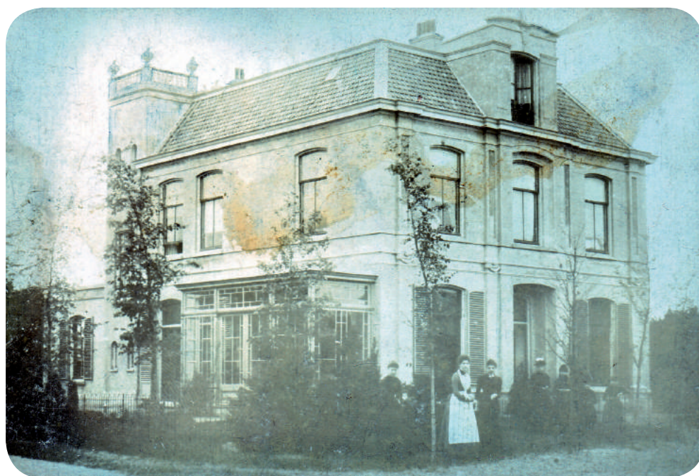
Instituut Roodhuyzen (later Instituut Brandsma) aan de Graaf Wichmanlaan

Voor zover bekend opende de eerste Bussumse kostschool haar deuren rond 1850. In de Vesting Naarden bestonden ze al langer, en ook het enkele Bussumse kind voor wie het gemeenteschooltje niet geschikt werd bevonden, vond hier een alternatief. Maar omstreeks 1875 veranderde dat. Als paddenstoelen schoten de particuliere scholen uit de Bussumse grond. Er was kennelijk een dringende behoefte aan beter lager onderwijs in het eigen dorp. Daarnaast ontstond er in deze jaren een groeiende markt van scholen die ook kost en inwoning aan schoolgaande jongens en meisjes boden.