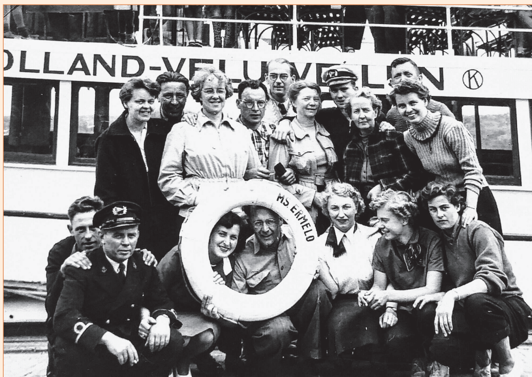
De leerkrachten met de bemanning

boek te werken. Ook scheepstermen werden aangeleerd. De kinderen werden ingedeeld per bak , met een bakmeester of bakjuf . Er werd geslapen in het ruim en gegeten in de kajuit, waar ook de kombuis was. Op gezette tijden mochten de kinderen op het dek zitten.