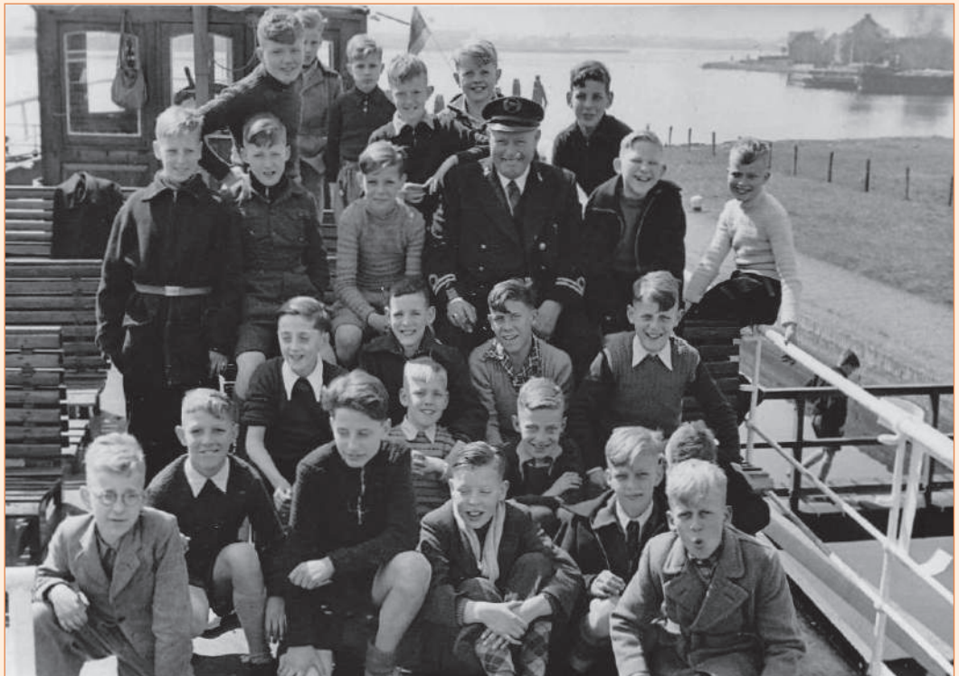
Leerlingen op het dek van de Ermelo , 1951

De eerste keer was in 1950. Ongeveer 60 leerlingen en een groep leerkrachten gingen een week op reis met de Ermelo van de Holland-Veluwelijn. De tocht ging vanaf de haven van Huizen over het IJsselmeer naar Kampen, dan over de IJssel naar Deventer en Arnhem, vervolgens via de Nederrijn naar Nijmegen, dan over de Waal naar Dordrecht en Rotterdam en ten slotte over de Lek en het Amsterdam-Rijnkanaal naar Utrecht en Huizen. Zo konden de kinderen met eigen ogen zien wat hun tijdens de aardrijkskundeles was geleerd. Ruim tevoren werd de reis op school voorbereid en leerden de kinderen in een log-