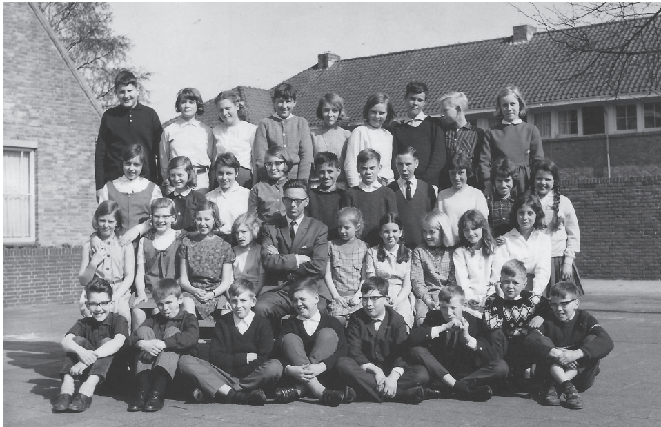
Klassenfoto uit 1966; linksboven de auteur van dit artikel

redelijk gemêleerd. Eén leerling werd regelmatig gebracht door de chauffeur van zijn vader, compleet in uniform met pet, en daar waren we toch wel een beetje jaloers op! En dan de meesters en de juffen. In de jaren zestig waren de onderwijzers sterk in de meerderheid en de onderwijzeressen juist in de minderheid, precies het tegendeel van nu. In het algemeen werd er goed lesgegeven op de Marijkeschool. Er waren beslist minder regels, minder