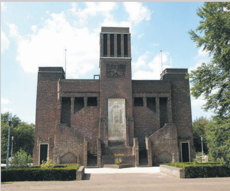
Het Belgenmonument in Amersfoort

Stichtse Rotonde in Amersfoort het imposante Belgenmonument. Het werd in 1917/1918 door Belgische geïnterneerden opgetrokken. De officiële onthulling was op 22 november 1938, op de 20ste verjaardag van de wapenstilstand. In aanwezigheid van koningin Wilhelmina bracht koning Leopold III de gedenkplaat