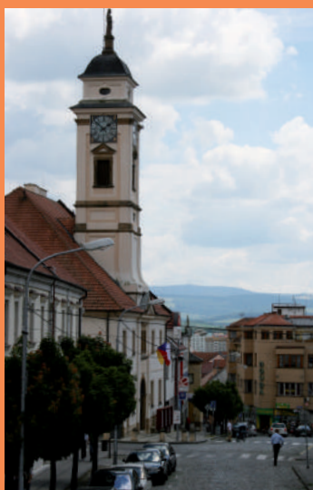
Het centrum van Uherský Brod

Behalve de activiteiten rondom Comenius vinden ook culturele uitwisselingen plaats. In Naarden en Uherský Brod zijn lokale stichtingen van vrijwilligers actief om dat mogelijk te maken. De verbondenheid tussen de vrijwilligers is groot en er zijn veel contacten en vriendschappen ontstaan. In juni jongstleden is de laatste reis vanuit Naarden gemaakt, om een Hollandse kraam in te richten op de regionale streekmarkt, met stroopwafels, kaas en advocaat. Muziekvendel Nardinck verzorgde diverse optredens. De stichting Naarden-Uherský Brod wil met de gemeente Gooise Meren in gesprek om de stedenband verder vorm te geven. Daarbij zullen Comenius en culturele uitwisseling belangrijke pijlers blijven.