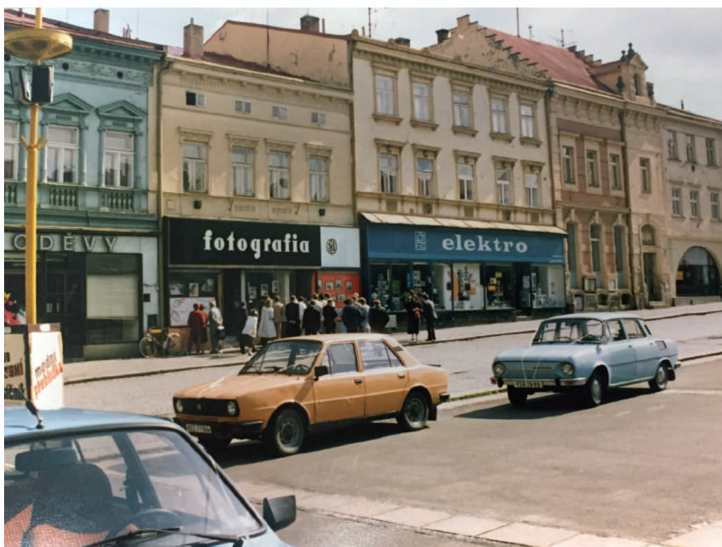
Stadsplein van Valašské Meziříčí in 1990

regerende communistische partijen, en niet door de (lokale) bevolking zelf. Na de Wende van 1989 werden de gemeenten in Nederland uitgenodigd stedenbanden te realiseren in Oost-Europa. In de Bussumse politiek bestond een voorkeur voor een gemeente in Tsjecho-Slowakije. In Nederland was een Tsjecho-Slowaakse vereniging actief van