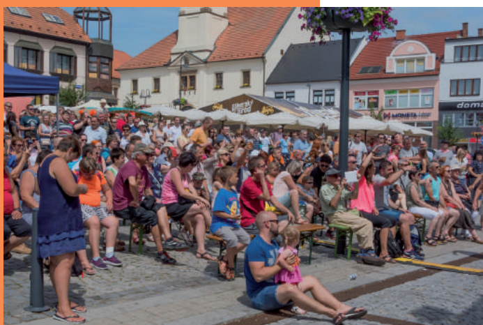
Veel belangstelling op het stadsplein voor de Naardense muzikanten