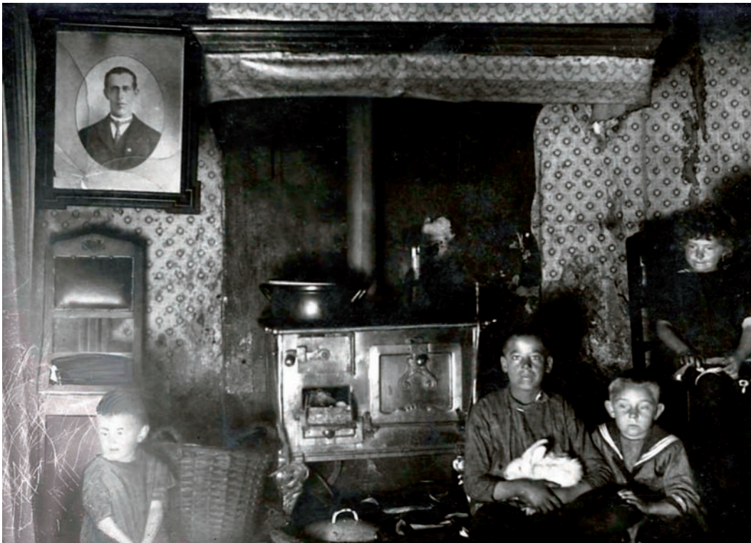
De krotten van Naarden. In deze vervallen kamer (St. Annastraat 16) woonde een gezin van tien

De Woningwet legde de basis voor rijk en gemeente om woningbouwverenigingen financieel te ondersteunen. Hiermee ontstond een nieuw type vereniging, gericht op verbetering van de volkshuisvesting. Door subsidies en goedkope leningen moest de bouw van relatief dure huurwoningen (die immers aan allerlei eisen moesten voldoen) rendabel worden gemaakt.