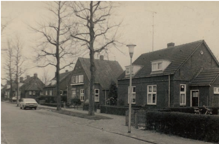
De straat in de jaren zeventig

gezonde leefomgeving voor arbeiders, net buiten de stad. Kortom, een soort villawijk voor arbeiders.