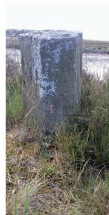
Grensmaal op de Bussumerheide

Toen Bussum vanaf 1874 door de aanleg van station Naarden-Bussum een gewild woonoord werd voor (vooral)