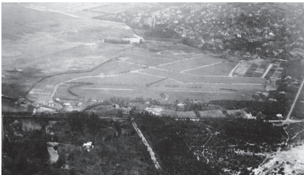
Luchtfoto van Cruysbergen uit 1925. Op de voorgrond de Franse Kampweg met villa Cruysbergen, daarachter de Hilversumse Meent, rechtsboven het Spiegel (foto Archief Gooise Meren en Huizen)

erfgooiers, waarbij de laatsten hun gebruiksrecht over een deel van hun gebied opgaven, en in ruil daarvoor het eigendomsrecht kregen over het resterende deel van de woeste gronden. De erfgooiers kregen 3678 hectare weiden, bos en heide en Domeinen 1735 hectare bos en heide. De zogenoemde definitieve heideverdeling kwam tot stand in 1843. Domeinen verkocht een deel van de grond die aan haar was toegevallen aan particulieren, onder