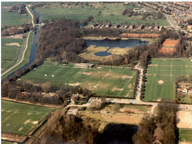
De sportvelden bij de Meerweg in 1980

Hilversum met een sikkelvormig stuk land in oostelijke richting op de Eng uit te breiden. Bussum wilde graag de hele Eng en was bereid als compensatie een stuk Bussumerheide af te staan, maar de regering bleef bij haar standpunt. De protesten ten spijt werd het voorstel zonder discussie aangenomen in de Eerste en Tweede Kamer. De nieuwe grens werd de Doodweg, een voorloper van de Laarderweg. 1 In totaal kreeg Bussum er een gebied van bijna 168 hectare bij, waar 86 mensen woonden.