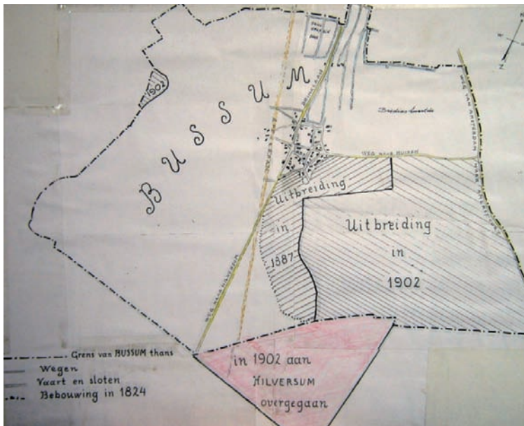
De grenswijzigingen in 1887 en 1902, ingetekend op de kaart van 1824

Hilversum met een sikkelvormig stuk land in oostelijke richting op de Eng uit te breiden. Bussum wilde graag de hele Eng en was bereid als compensatie een stuk Bussumerheide af te staan, maar de regering bleef bij haar standpunt. De protesten ten spijt werd het voorstel zonder discussie aangenomen in de Eerste en Tweede Kamer. De nieuwe grens werd de Doodweg, een voorloper van de Laarderweg. 1 In totaal kreeg Bussum er een gebied van bijna 168 hectare bij, waar 86 mensen woonden.