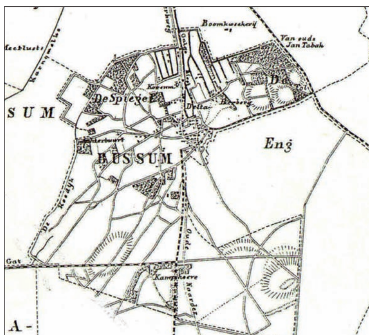
Bussum in 1860; de Eng ligt nog op Hilversums grondgebied

De woeste gronden ten zuiden van Bussum waren vanouds bekend als het Naarderveld. De grens was in 1396 en 1428 bepaald als lopende van Cruysbergen over