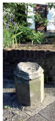
Grensmaal op de Prinsenstraat