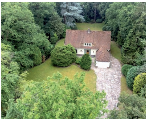
De door G.H. Hofstee ontworpen villa uit 1954 (Amers- foortsestraatweg 101)

De bewoners van de laatste vier woningen aan de Amersfoortsestraatweg zijn behoorlijk ongerust over de plannen die ontwikkeld worden voor het Crailoterrein. Zij vrezen dat hun woningen op een uiterst merkwaardig schiereiland komen te liggen, want de ontsluitingsweg van Plan Crailo gaat vlak achter hun tuinen lopen. Dan hebben ze dus de Amersfoortsestraatweg en de A1 aan de voorkant, de Amersfoortsestraatweg ook aan de zijkant, want die maakt een bocht, en de Panoramaweg van Plan Crailo aan de achterkant. De gemeente Hilversum heeft bovendien achter de betreffende woningen een hoog gebouw aan de overkant van de Panoramaweg gepland.