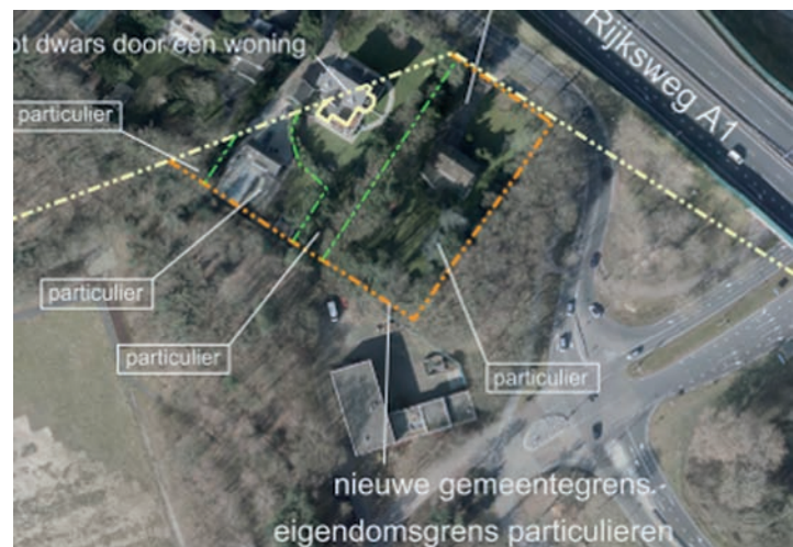
De vier huizen aan de Amersfoortseweg (uit: Toelichting Grenswijziging gemeente)

In 1902 was er opnieuw een grenscorrectie. Deze keer werden in goed overleg enkele grote stukken grond geruild. Bussum kreeg de Eng tot aan de grens met Huizen. De grens werd nu de Naarderstraatweg, de tegenwoordige Amerfoortsestraatweg. Hieraan lagen de herberg De Gooische Boer, vijf huizen en een koepel 2 . De bebouwing van de Huizerweg was nu aan beide zijden Bussums grondgebied. Aan de voormalig Hilversumse kant stonden enkele fabrieken als de leerbewerkingsfabriek Koelit en de schoensmeerfabriek Jumbo 3 . Bussum kreeg ook nog een stukje van de Hilversumse Meent bij de in 1898 gebouwde