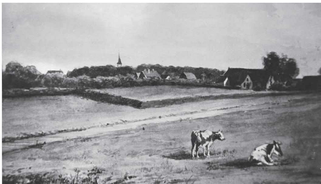
Bussum gezien vanaf de Hilversumse Meent (foto van tekening, collectie Winthorst)