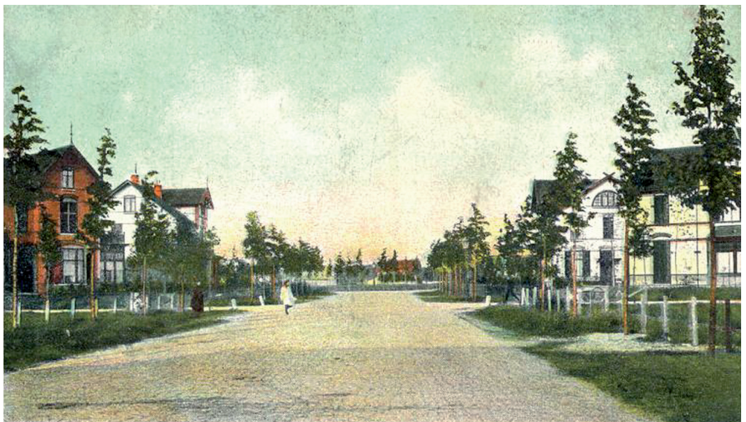
Ansichtkaart van de Prins Hendriklaan uit 1905

Nadat revolutionairen in Rusland in 1917 de tsaar hadden afgezet en de Duitse keizer Wilhelm II op 9 november 1918 naar Nederland had moeten vluchten, hield