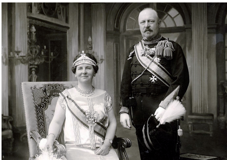
Koningin Wilhelmina en prins Hendrik

Het vijftienvijftigjarig regeringsjubileum van Wilhelmina in 1923 was mede daarvoor voor alle dorpen en steden aanlei-