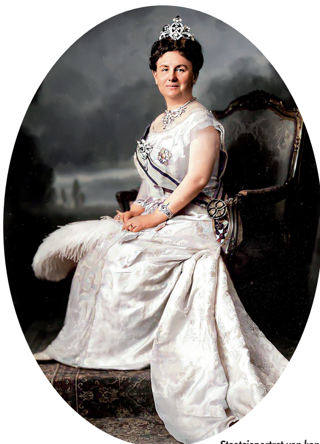
Staatsieportret van koningin Wilhelmina in 1923

ding voor groots opgezette feesten. Ook Bussum pakte uit met een indrukwekkend feestprogramma van drie dagen, waarvan de hoogtepunten werden vastgelegd in een (stille) film die theater Novum liet vervaardigen.