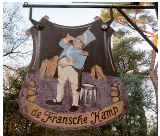
Uithangbord van camping De Fransche Kamp