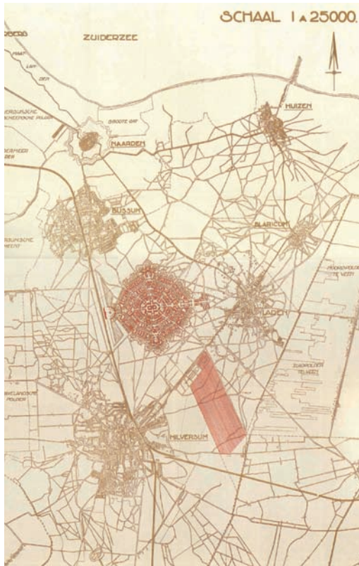
Deze 'stadswijk' van Amsterdam zou tussen Bussum, Hilversum en Laren komen, met een aansluiting op de spoorlijn

De overige erfgooiers waren weliswaar mede-eigenaren van grond, maar hadden daar geen profijt van. De lokale overheden voelden zich in hun bewegingsruimte beperkt door de erfgooiers. De gemeenten hadden heel andere belangen dan de erfgooiers: ze wilden de grond gaan gebruiken voor havens en bedrijventerreinen; ze wilden zand afgraven en verkopen; ze wilden woonruimte bieden aan kapitaalkrachtige (en belastingplichtige) nieuwe inwoners.