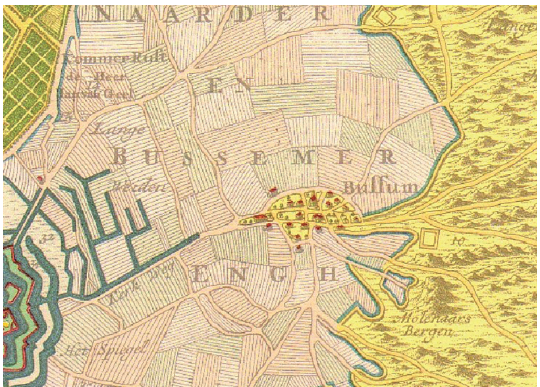
Bussum en omgeving op een kaart uit 1734

Het boerenbedrijf verloor in hoog tempo aan betekenis. De grond was arm en de opbrengst gering, schapen- en koeienmest werden overvleugeld door kunstmest. De weidegrond en bos en hei waren eigendom van de erfgooiers, van wie echter maar een klein deel een boerenbedrijf uitoefende.