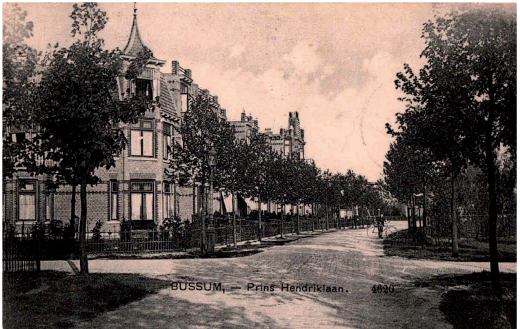
Het Prins Hendrikpark is aangelegd en bebouwd tussen 1900 en 1930

sen villawijken ontstaan, zoals (in Bussum) het Spiegel, het Prins Hendrikpark en omstreeks 1923 het Brediuskwartier.