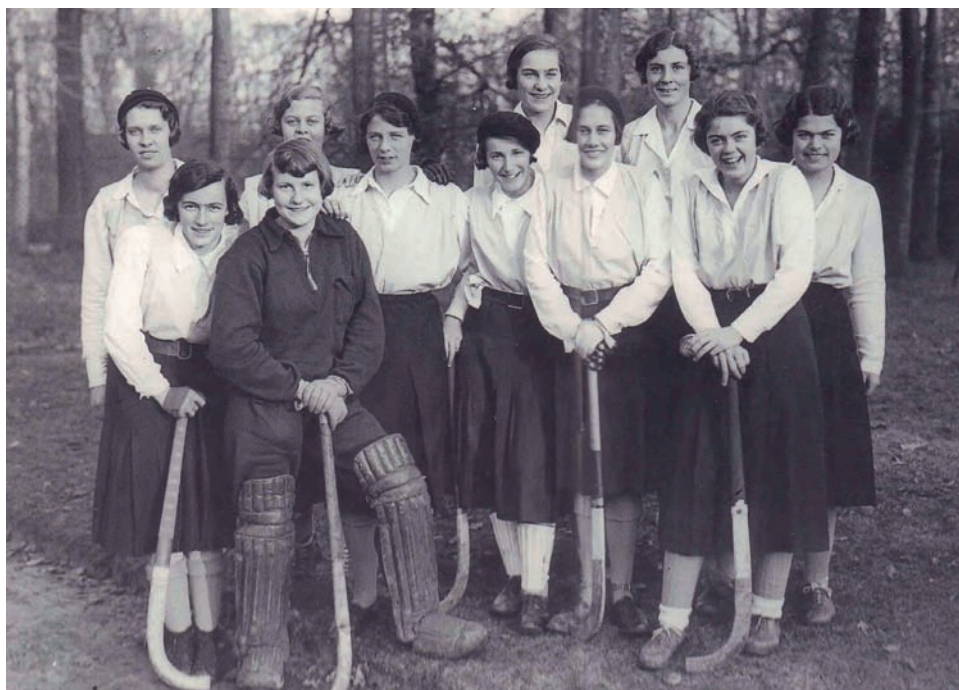
Damesteam van de Gooische Hockeyclub in 1924

Maar er werden ook andere sporten bedreven. Onder dames, die immers niet voetbalde, was gymnastiek populair. In de jaren