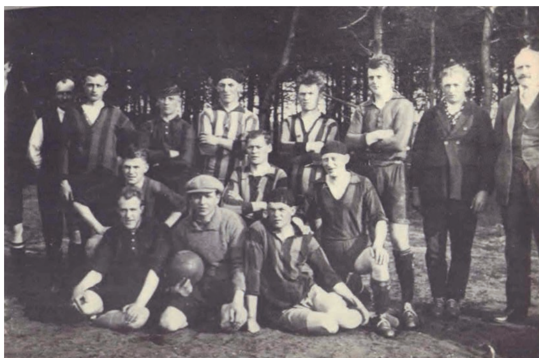
Het voetbalteam van De Kaap