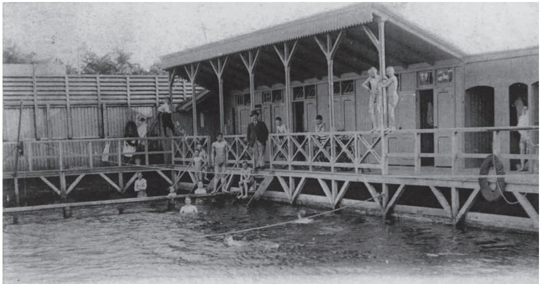
Het zwembad van 1924