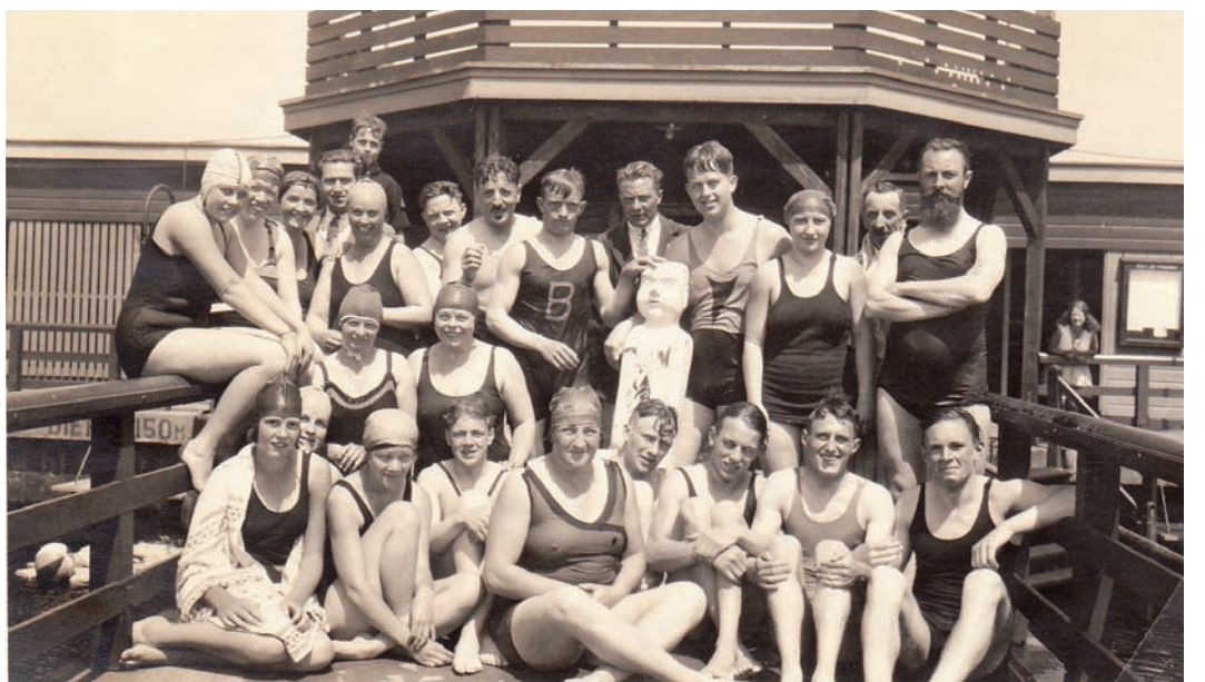
Zwemmers en zwemsters, jaren twintig