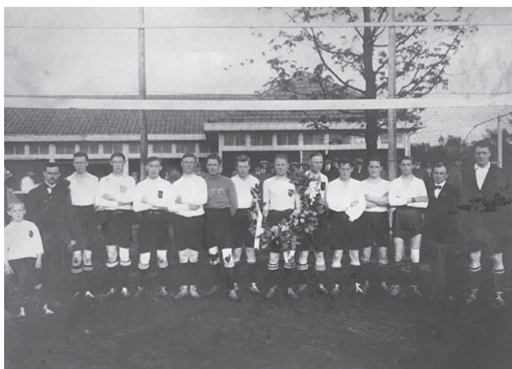
Het kampioenselftal van BFC in 1924