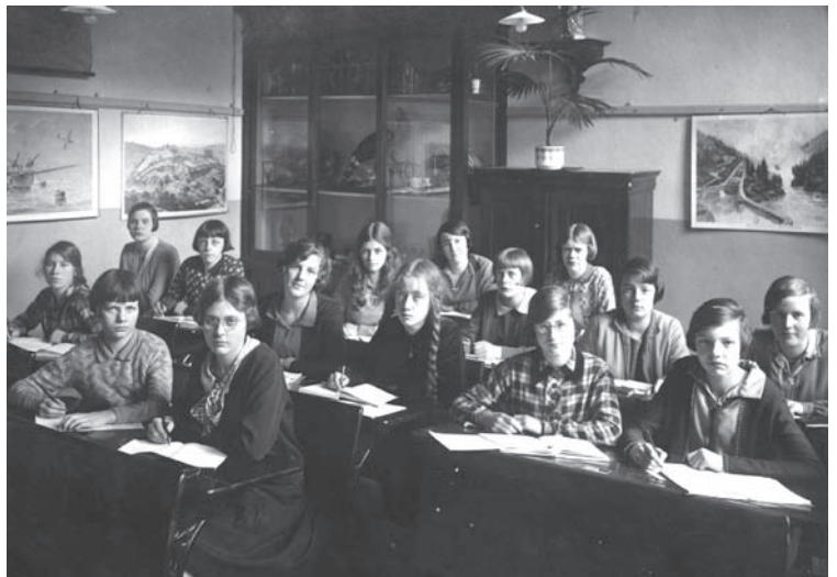
Schoolklas van de Maria-ulo in 1930