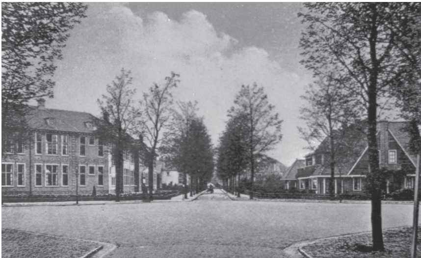
De Gooische hbs in 1925