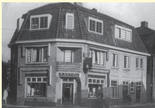
Winkelpand aan de Herenstraat 28

Karel de Bazel (1869-1923) is de enige Nederlandse architect naar wie een gebouw is vernoemd: gebouw De Bazel aan de Vijzelstraat (nr. 32), waar het Stadsarchief van Amsterdam is gevestigd. Hij ontwierp niet alleen huizen, maar ook interieurs, meubels en glaswerk en (in 1909) het wiegje van prinses Juliana. Hij ontwierp al aan het begin van de 20ste eeuw het stratenplan van het Brediuskwartier. In het Godelindekwartier ontwierp hij de huizen aan de Adelheidstraat, Godelindestraat en de Godelindedwarsstraat.