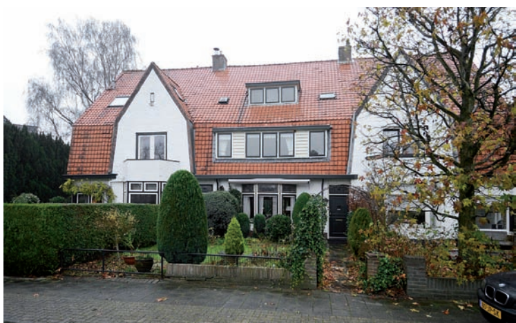
Middenstands- woningen aan de Lothariuslaan (J. Wilke)