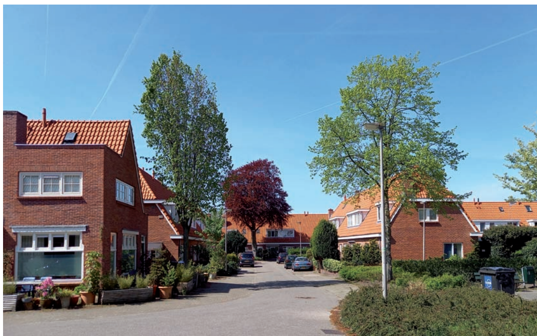
Het Eendrachtspark (T. Kuipers)