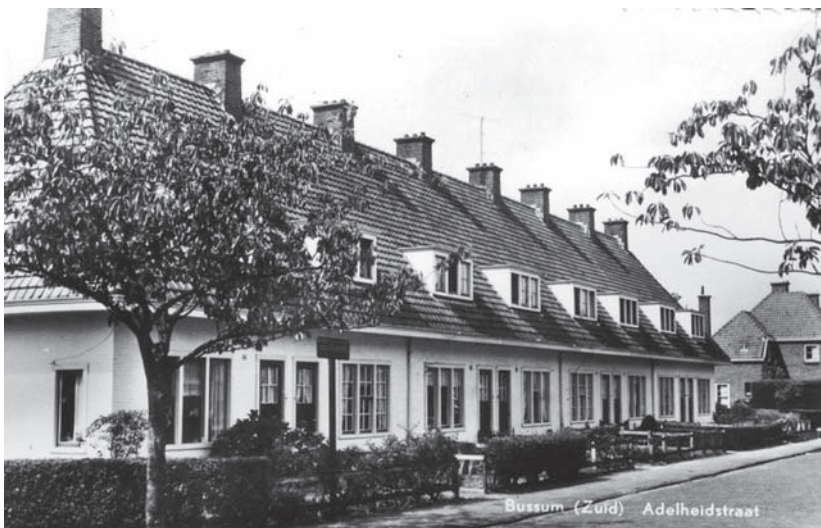
De Adelheidstraat in de Godelindebuurt (K.P.C. de Bazel)