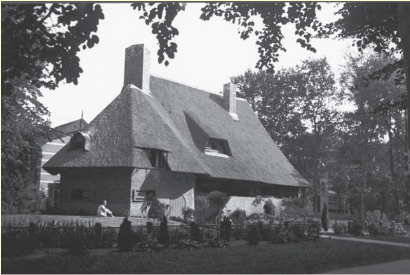
Villa Amby aan de Nieuwe 's-Gravelandseweg