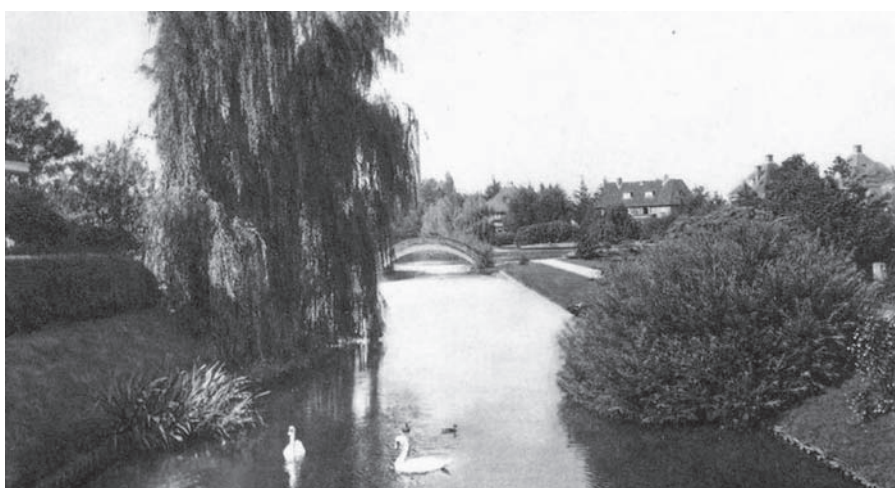
Het Bilderdijkpark in 1928 (toen het nog het Nieuwe Plantsoen heette)