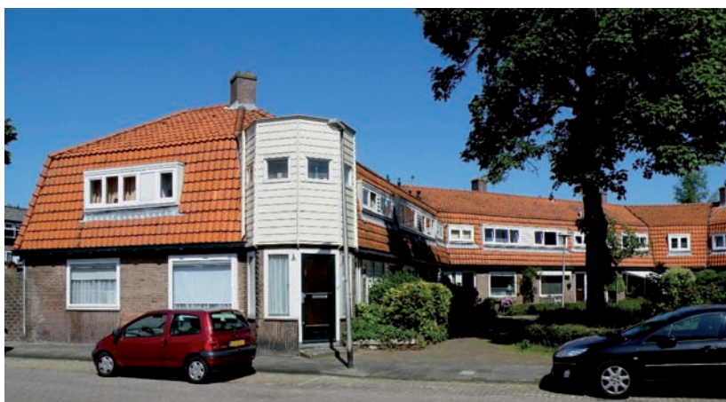
Het Oosterpad (G.J. Vos)