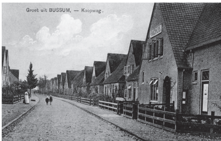
Arbeiderswoningen aan de Koopweg (H. Everts)

Tussen 1916 en 1923 liet de Algemeene Arbeiders Bouwvereniging Bussum