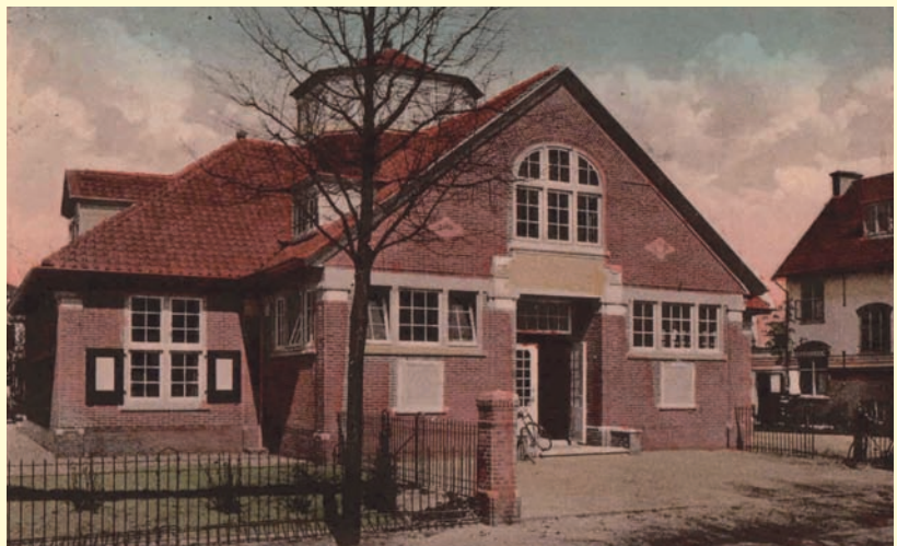
De voormalige Openbare Leeszaal en Bibliotheek aan de Generaal de la Reijlaan