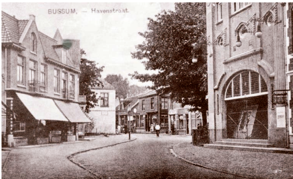
Havenstraat met rechts filmtheater Flora Bio

Een geliefd toneelspeler was Louis Bouwmeester. Op 24 september 1922 werd hij wegens het bereiken van de tachtigjarige leeftijd in Concordia gehuldigd na een jubileumvoorstelling van Shakespeares 'De koopman van Venetië', waarin hij de rol van Shylock speelde.