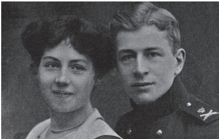
Hens en Bien Clinge Doorenbos in 1914