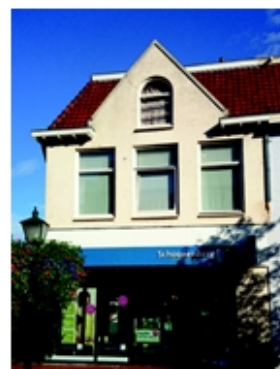
Het pand nu.