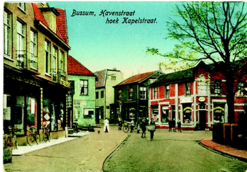
Albert Heijn winkel geheel links.

Vergunningaanvraag, getekend door Albert Heijn zelf.