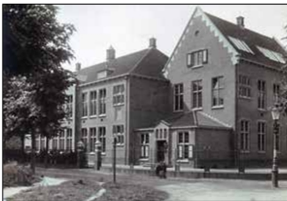
De nieuwe Emmaschool in 2015.

geloofsgebonden school in Het Spiegel. De gemeente Bussum ontvangt een petitie van enkele honderden bezorgde ouders en vervult haar wettelijke plicht om voor voldoende mogelijkhe-