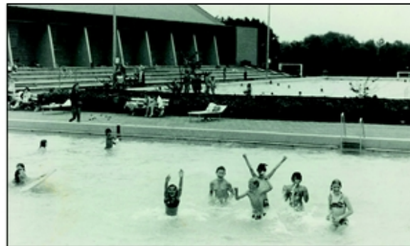
Het Sportfondsenbad in 1978

Vergeeten is meteen het moeizame proces om tot een goede locatie voor het nieuwe bad te komen. Herinrichting van de vroegere Bussumse zwembaden (aan de Huizerweg en aan de Meerweg)