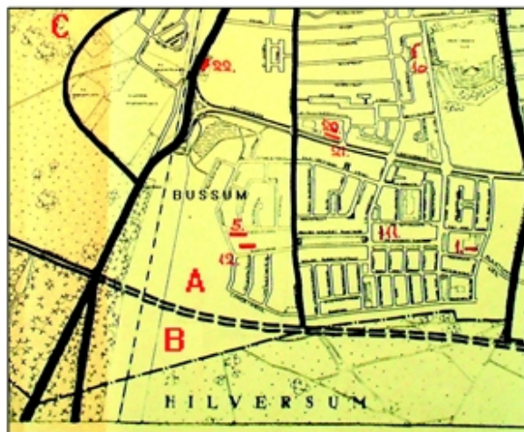
Kaart van Bussum Zuid omstreeks 1960. De onderbroken dubbele lijn geeft de niet-aangelegde weg over de hei weer. In rood A, B en C de drie mogelijke locaties voor het zwembad. De getallen (rood) geven de plaatsen aan waar scholen staan.

Bij deze mogelijke bouwlocatie moet dan worden gekozen: of een zwembad aan de Bussumse kant