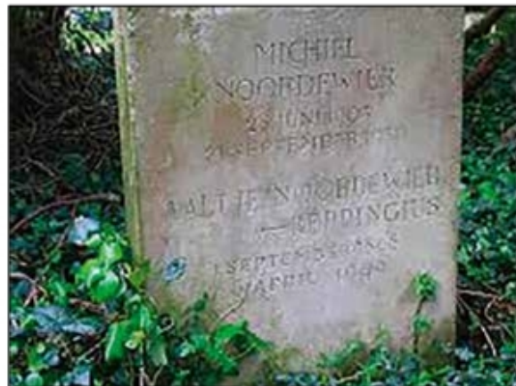
Grafsteen Nieuwe Algemene Begraafplaats Hilversum