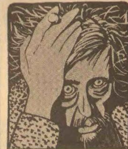
● KLOOS... wonderbaar maaksel.