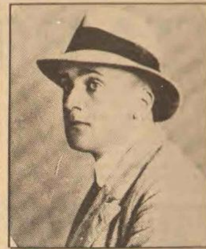
● NESCIO... kolombijntjes.