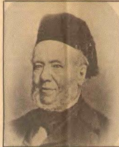
● POTGIETER... verrukt.