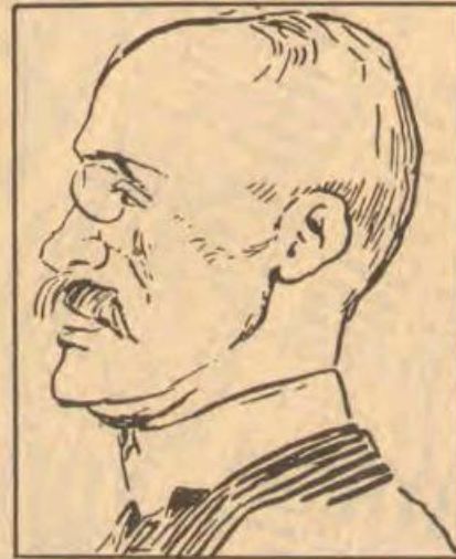
● GORTER... breuk.