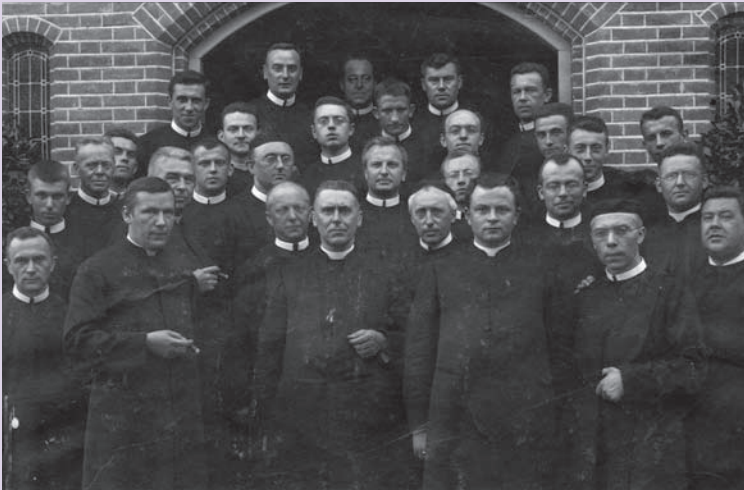
Inzegening van Klooster St. Jozef, Vitusstraat 4 in Bussum, ingezegend op 28 augustus 1911