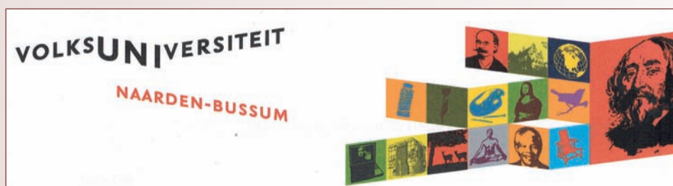
Het logo omstreeks 2010

voormalige Fatima- en Jozefschool aan de Ceintuurbaan. De Volksuniversiteit had het in deze jaren overigens moeilijk, doordat ook veel andere organisaties cursussen en lezingen aanboden.