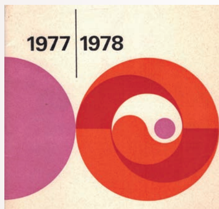
Het logo werd in de jaren zeventig vernieuwd

In 2006 verhuisde de Volksuniversiteit opnieuw, nu naar het gebouw van de Openbare Bibliotheek Naarden-Bussum,