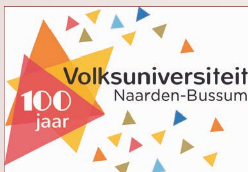
Het logo 2020

tegenwoordig Bibliotheek Gooi en Meer geheten. Daar heeft men de beschikking over een kantoor, computerruimte en leslokalen. Nieuwe ontwikkelingen rond het 90-jarig bestaan in 2010 waren: een kwaliteitszorgsysteem met daaraan gekoppeld een erkenningsregeling, een website, het digitaal verspreiden van nieuwsbrieven en samenwerking met de bibliotheek. Men experimenteert ook met thema's, waaromheen activiteiten worden georganiseerd. Zo was er een jaar met als thema Italië. Inmiddels zijn er op tal van gebieden ontwikkelingen die het werk van de Volksuniversiteit minder bijzonder maken dan in de decennia daarvoor. De Volksuniversiteit is thans een van de vele organen die kennis, vorming en ontspanning op traditionele en moderne manieren aan de bewoners van de regio aanbieden.