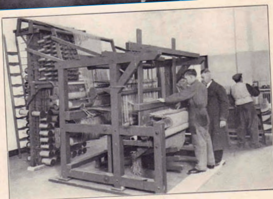
In de groote werkzaal waar door nijvere handen mooie ruige matten worden geweven.

scholieren binnen het totale onderwijs aan blinde en slechtziende kinderen in Nederland. Geleidelijk aan vond er een differentiatie plaats tussen (algemeen) onderwijs en vakopleiding enerzijds en onderwijs aan blinde en aan (zeer) slechtziende kinderen anderzijds. Een aparte categorie werd gevormd door meervoudig gehandicapte blinde kinderen, in het bijzonder blinde kinderen met een verstandelijke beperking. Voor al die groepen werden op den duur aparte voorzieningen gecreëerd. In Huizen kwamen de echt blinde kinderen terecht, terwijl de slechtziende kinderen, met een geheel ander didactisch programma, in