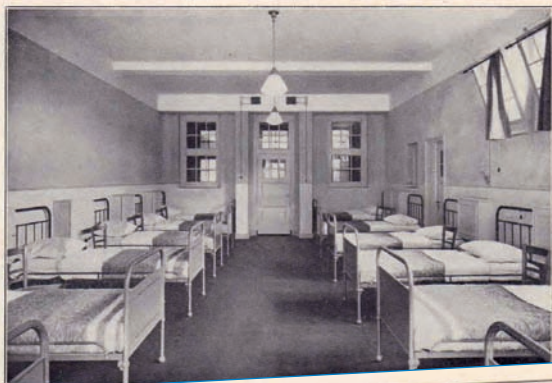
Een der acht slaapvertrekken, ruim en frisch, met haatjes voor de kweelingen