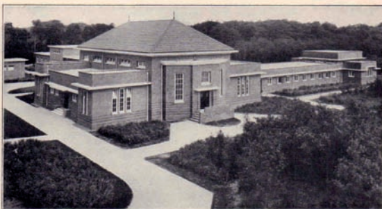
In dit gebouw zijn ondergebracht een groote orgelzaal biedende voor 300 personen, kleine orgelzaal, 20 studeerkamertjes, 2 leslokalen en de werkplaats voor het repareren en stemmen van piano's en orgels.