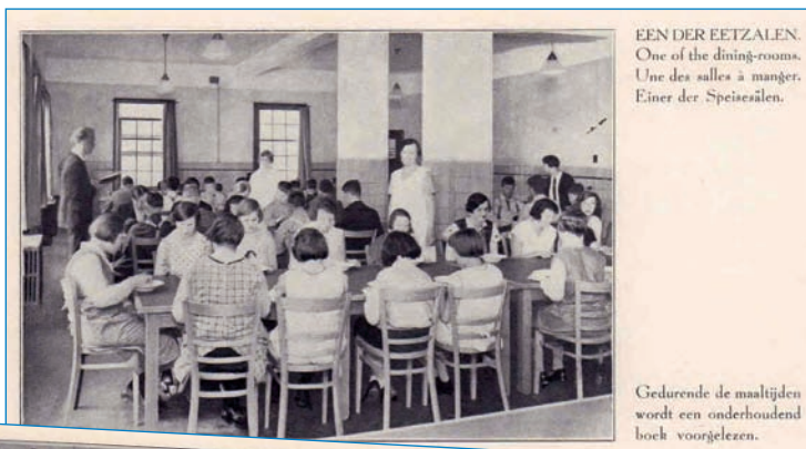
EEN DER EETZALEN. One of the dining-rooms. Une des salles à manger. Einer der Speisesalen.

Ook in andere opzichten waren het turbulente tijden. De zorg, die lange tijd gecentraliseerd was geweest in een klein aantal gespecialiseerde instituten, waar de cliënt werd ‘opgenomen’, moest nu naar de cliënt worden gebracht. Er werd een proces van regionalisatie in gang gezet, waarbij de moeizaam verworven inhoudelijke specialisatie van de drie instituten in Huizen, Zeist en Haren (namelijk blinde en slechtziende mensen en mensen met een meervoudige handicap) weer ongedaan werd gemaakt. Het voert te ver om hier alle bestuurlijke en organisatorische perikelen uit de doeken te doen, waarmee deze regionalisatie gepaard ging. De uitkomst was dat de hele zorg voor blinden en slechtzienden een totale verandering onderging. De voormalige blindeninstituten, met hun nadruk op intramurale zorg voor blinde en slechtziende kinderen, werden omgevormd tot serviceorganisaties die zorg op maat bieden aan een veel bredere doelgroep en met een veel uitgebreider pakket aan voorzieningen en faciliteiten. Een blik op de website van Visio ( www.visio.org ) is voldoende om dat duidelijk te maken. Terwijl de zorg werd gedecentraliseerd, werd de aansturing daarvan juist gecentraliseerd. In 1988 sloten de op dat moment vrijwel zelfstandige instituten in Huizen,