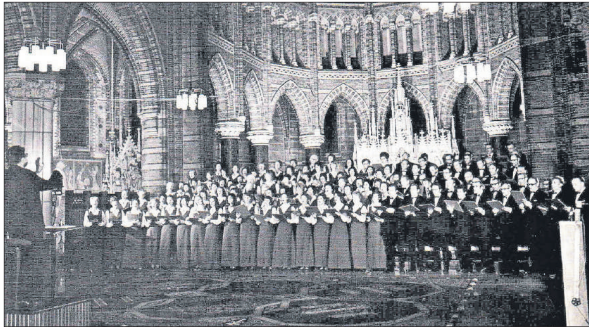
■ Pro Musica in de jaren 50. Plaats en datum van deze foto zijn onbekend.

sum. In juni 1956 werd een tegenbezoek gebracht. Ruim honderd leden, meest (huis)vrouwen – de mannen moesten werken – vertrokken in de nacht van 14 op 15 juni naar Engeland. Natuurlijk niet per vliegtuig!