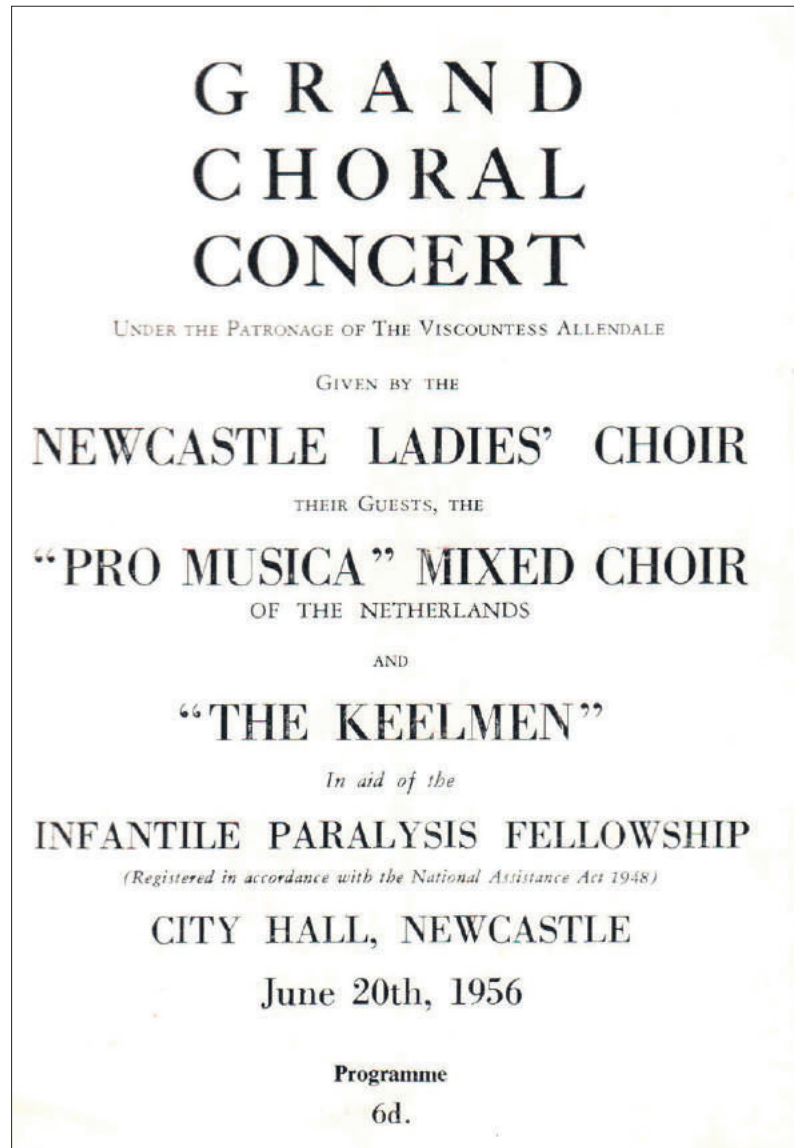
■ Het programma van het Concert van woensdag 20 juni 1956.

Pro Musica groeide in rap tempo uit tot ver over de honderd leden en had via de NCRV-radio landelijke bekendheid verworven. Ook waren er internationale connecties aangeknoopt. In mei 1955 was The Newcastle Ladies Choir een week te gast geweest in Bus-