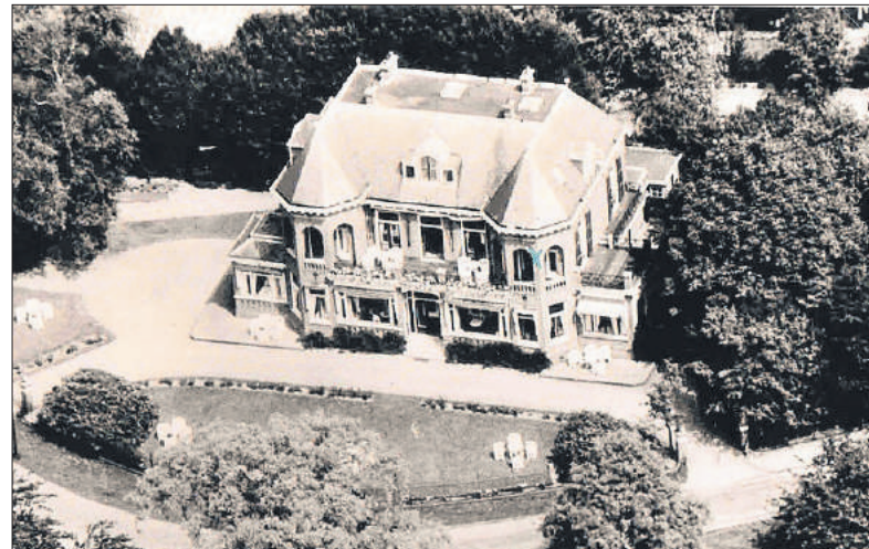
■ Hotel Edinoor omstreeks 1960.

De villa werd in 1920 aangekocht door Lien Kaarsgaren. Deze vrijgevochten ongehuwde dame was eerder mede-eigenaar van hotel-pension Beerenstein aan de Beerensteinerlaan, waarover in een volgend artikel meer. Zij gaf de villa meteen een andere naam: al in maart 1920 verscheen een advertentie voor een veiling van 'een net onderhouden inboedel'