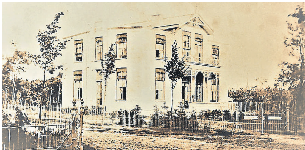
■ Villa Parkzicht aan de Parklaan 4.

Ze werd als pensionhouder opgevolgd door het Duitse echtpaar