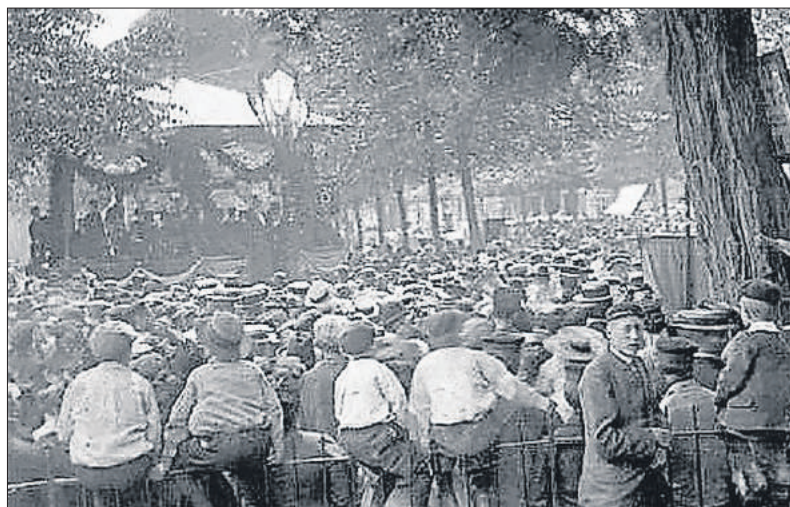
■ Concert in de muziktent op de Brink.