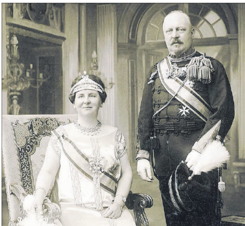
■ Koningin Wilhelmina en Prins Hendrik.

Tijdens de regeringsperiode van de grillige koning Willem III, die in 1890 overleed, was de monarchie haar populariteit kwijtgeraakt. Zijn weduwe Emma, die als regentes optrad tot haar dochter prinses Wilhelmina 18 jaar was, deed er alles aan om die populariteit te herwinnen. Al in 1892 nam ze de 12-jarige Wilhelmina mee op een tour langs alle elf provincies.