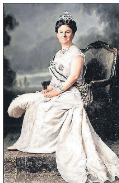
■ Staatsieportret koningin Wilhelmina in 1923.

Om 15.00 uur was er een bloemencorso door Bussum en om 16.30 uur een zanguitvoering op de Brink door ongeveer honderdvijftig zangers. 's Avonds waren er nog wedstrijden op het sportterrein en op de Brink was muziek van de Nieuwe Amsterdamsche Orkestvereniging te beluisteren.