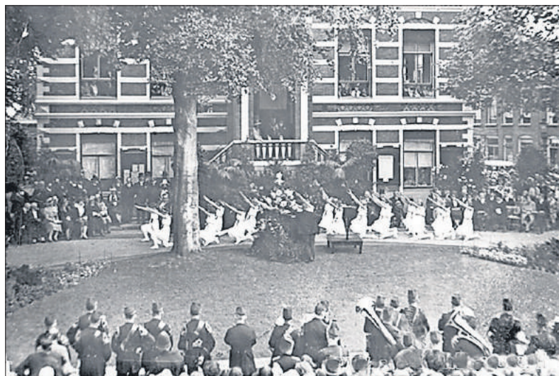
■ Jeugdmanifestatie bij het gemeentehuis.

Op 30 augustus waren er de hele dag sportwedstrijden en volksspele op het gloednieuwe sportterrein aan de Meerweg. Om 11.30 uur zongen de kinderen van R.K. Volkszang op de Brink en om 14.00 uur waren er schietwedstrijden vanaf vijftien meter afstand.