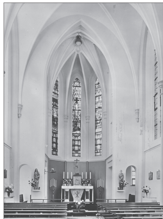
■ De kapel op de eerste verdieping van het klooster, waar de tentoonstelling te zien zal zijn.