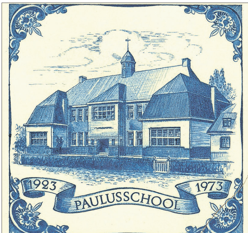
■ De School met de Bijbel werd in 1923 geopend. Later omgedoopt in Paulusschool en thans kinderdagverblijf De Bommelburcht.

Kom dus kijken. De expositie wordt geopend op zaterdag 2 september om 12.00 uur. Daarna is hij nog te zien op zondag 3 september en op zaterdag 9, 16 en 23 september, steeds van 12.00 tot 16.00 uur. Het is ook de laatste kans om de kapel van Mariënborg te bekijken, want na september begint de grote verbouwing.