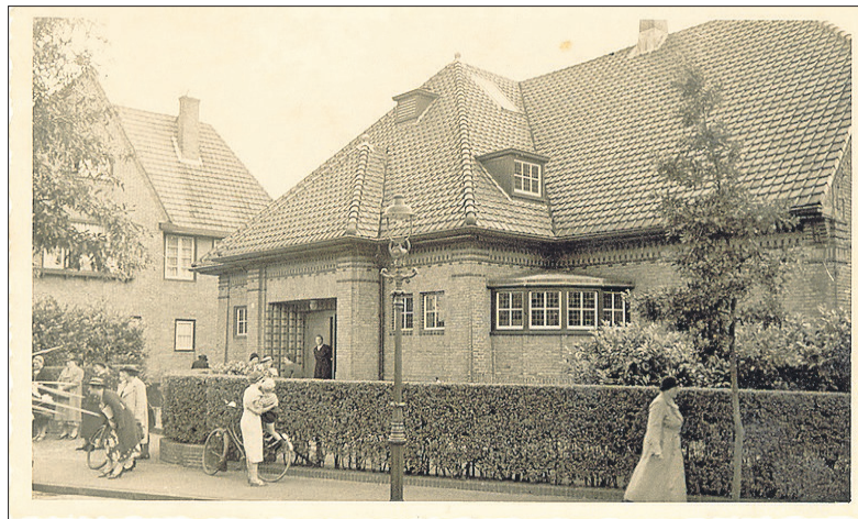
■ Ook de doopsgezinde kerk aan de Wladimirlaan werd in 1923 geopend. Het werd toen 'Huis ter Vermaning' genoemd.

Bussum had destijds zo'n twintigduizend inwoners en was ook wat de bebouwing betreft aanzienlijk kleiner dan nu. Op de kaart uit 1924 ontbreken de Ceintuurbaan en de Wester- en de Oostereng, maar ook het grootste deel van het Brediuskwartier en bijna alle bebouwing ten zuiden van de Huijzerweg. Het schootveld van de vesting Naarden was nog geheel onbebouwd. Er was schoorvoetend een begin gemaakt met sociale woningbouw in het katholieke St. Jozefpark, het protestantse Oosterpad en in de socialistische