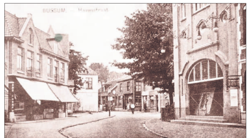
■ De Havenstraat met rechts bioscoop Flora Bio.