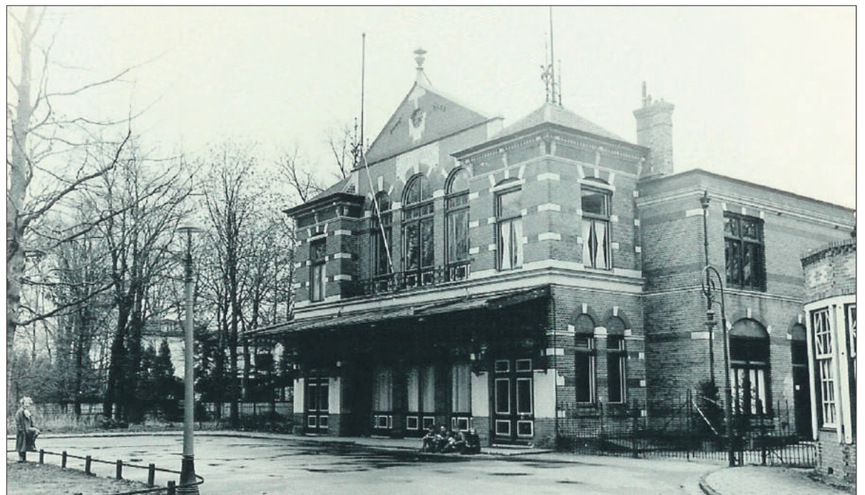
■ Theater Concordia voor 1930.

werd in 1920 al op neergekeken: je kon toch wel lezen! Explicateurs waren er toen alleen nog bij documentaires, die de film zelfs stilzetten als hun uitleg meer tijd vergde.