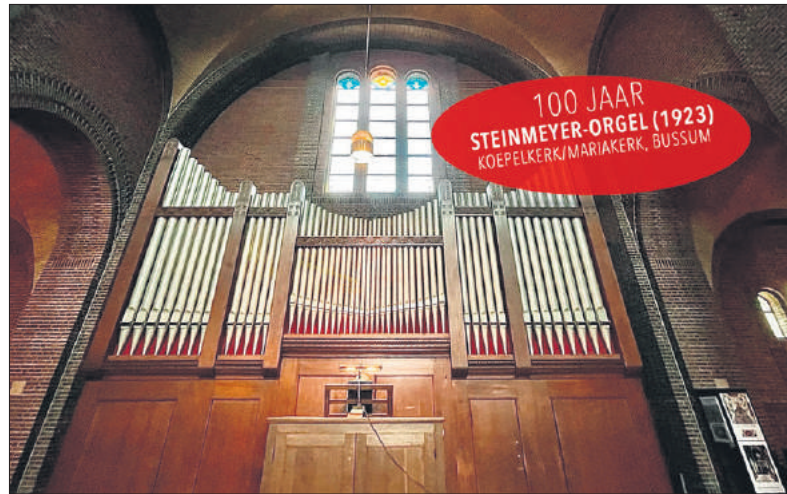
■ Op zijn nieuwe plek in de Koepelkerk.