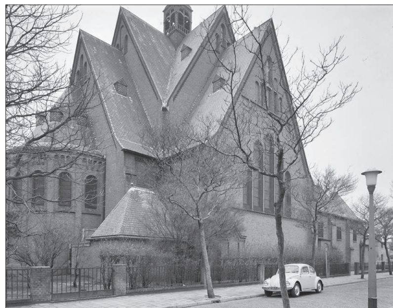
■ De Clemenskerk aan de Bosdrift in Hilversum.

Daarna braken rustiger tijden aan, want het orgel werd uitsluitend voor kerkelijke doeleinden gebruikt – er mochten in katho-