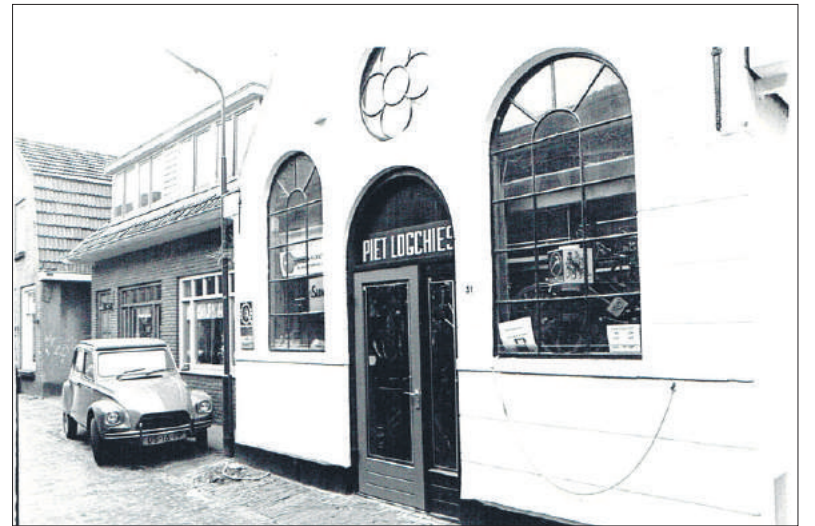
Hellingstraat 51, de winkel in het voormalige kerkje.