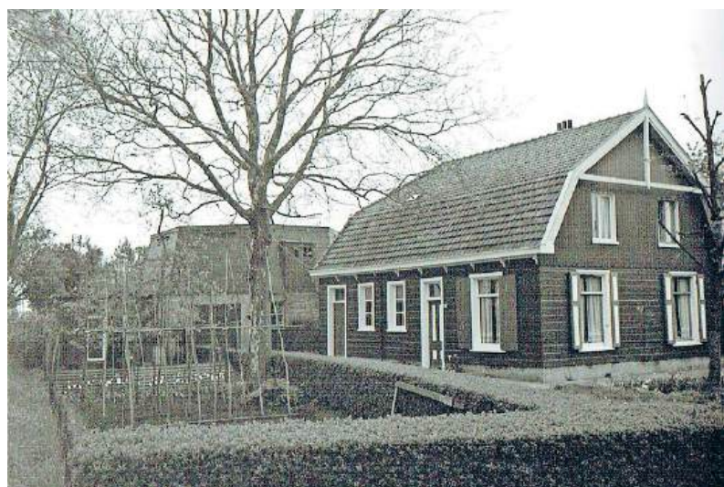
■ De boerderij van Van Nes en het molenrestrant in de jaren 60.