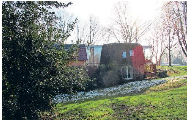
■ De doorgang van de boerderij naar het molenrestant.

De stadsplattegrond van Boxhoorn uit 1630 geeft de plaats aan