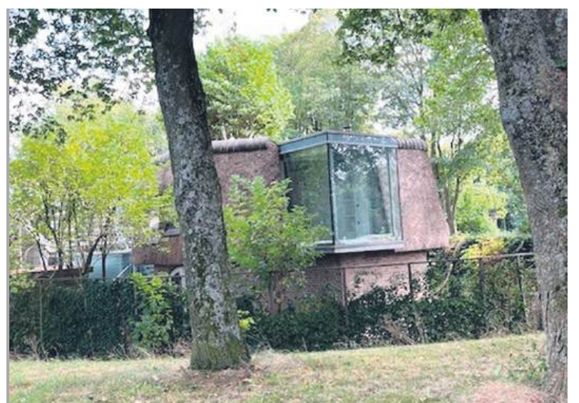
■ De situatie in 2024.