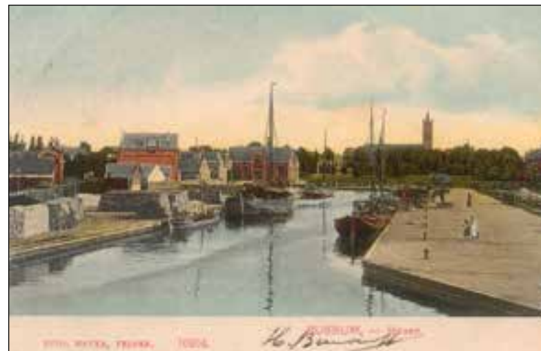
De Bussumse haven (met op de achtergrond de St. Vituskerk).

groeit zowel in Naarden en omgeving als in Den Haag het besef dat de reactie van de plaatselijke regimentscommandant op het uitbre-