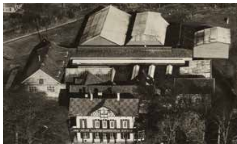
Van Meurs' Golfkartonfabriek met de tijdelijke opslagloodsen achter.