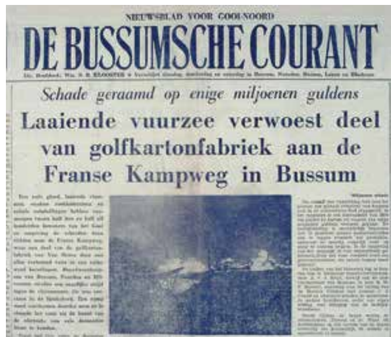
De Bussumsche Courant van 7 Januari 1965.