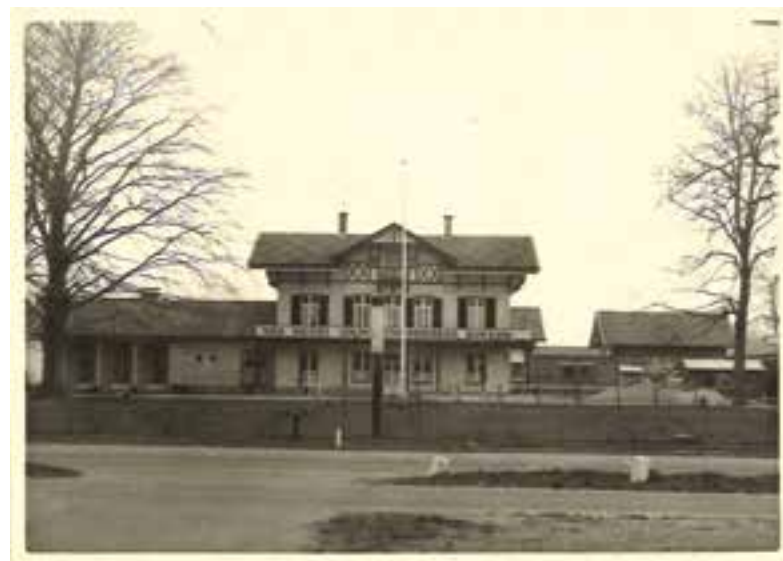
Het hoofdgebouw in 1960.

De brand van vijftig jaar geleden betekent zeker niet het slot van een volgend hoofdstuk in de bouwingsgeschiedenis van deze uithoek. Binnen korte tijd worden op het voetbalveld van de fabriek tijdelijke opslagloodsen gebouwd en wordt een ambitieus nieuwbouwplan ontwikkeld. De brand zorgt ervoor dat het bedrijf een uiterst modern aanzien krijgt. Tot de stillegging in 1995 rijden de vrachtwagens van Van Meurs af en aan over de Franse Kampweg. Op het fabrieksterrein is nu hocrecagroothandel Hocras geves-