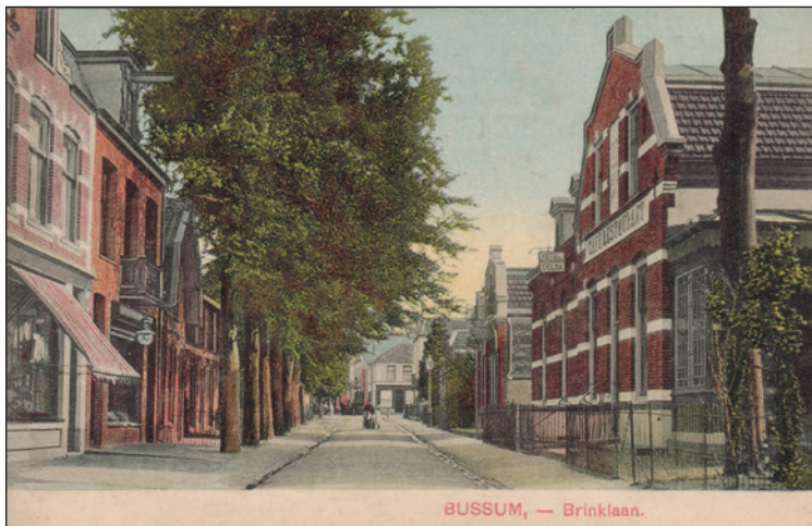
Brinklaan, rechts Café Delta, ongeveer op de plek waar nu de McDonalds staat

kenmerken van het amateurtoneel blijven. Op 21 november 1892 voerde het gezelschap Henri Burton, de vadermoorder op, tezamen met Uit het Studentenleven . Daarna moeten we wachten tot januari 1896 voor we weer iets van Vooruitgang zij ons doel vernemen. Op 16 januari werd in Hof van Holland in Naarden een "Soirée Variée" gegeven, met De Rooverhoofdman of Een Tooneel uitvoering te Niemandsdorp en Een snee met een scheermes . De recensent kon het wel waarderen: "De dilettanten toonden dat het hun ernst was flink voor den dag te komen en dit is werkelijk goed gelukt. Blijve de vereeniging steeds haar naam getrouw." Ruim een jaar later, op 25 april 1897, speelde Vooruitgang zij ons doel in de concertzaal van de heer Hopmans (locatie onbekend). Aan de titels van de stukken te zien ging men nog altijd vooral voor de gulle lach: Dirk de Porder (een porder ging 's morgens langs de deuren om mensen te wekken), De Buren en 't Consigne is Snorken . De laatste vermelding vinden we op 13 november 1897, toen men een uitvoering gaf in Hof van Holland te Naarden, met het al eerder vermelde stuk Flik en Flok in de klem en De bedrogen kastelein .