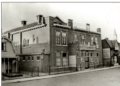
Links: het Sint Vitusgebouw aan de St. Vitusstraat

acht, toen nog geschreven als 7½ uur , en de toegang, of liever de Entrée , bedroeg 49 cent (bedenk dat dit even veel is als ruim zes euro vandaag de dag en dat het dagloon van een arbeider vaak niet meer dan fl. 1 tot fl. 1,5 bedroeg). Het gezelschap was kennelijk net opgericht, want later dat jaar, op 20 november, vierde men het éénjarig bestaan, opnieuw bij de heer Bus. Enkele maanden later, op 6 februari 1880, voerde het gezelschap alweer drie nieuwe stukken op: Fernand de Speler , dat volgens de recensent van De Gooi- en Eemlander "tot ernst stemde en tot in de ziel aangreep"; en voorts het kluchtspel Jocrisse de Vondeling ; en Neger Ständchen . Beide laatste stukken "bragten herhaaldelijk de lachspieren in beweging". Dit programma werd herhaald ten bate van de armen. De recensent zei daarvan "[...] wanneer het armen te helpen geldt, laten de ingezetenen van Bussum zich niet wachten", maar voegt daar enigszins belerend aan toe: "Uitzonderingen zijn er altijd op den regel." Enkele dagen later werd gemeld dat de