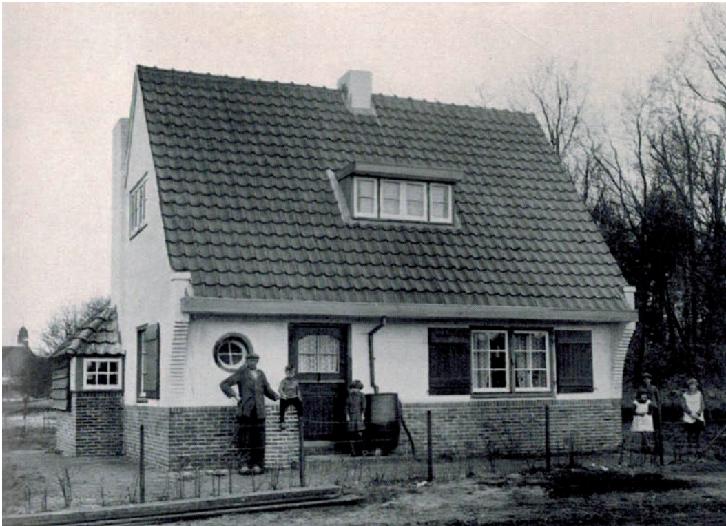
Dienstwoning Hilversumsche Meent

mocht worden, kwam laat in het voorjaar in het land, reeds vroeg in den zomer ontbrak het voedsel en inmiddels was de voedselvoorziening zeer onvoldoende geweest. Mager zochten de dieren, vooral op de Hilversumsche Meent, te midden van biezen en slechte grassen hun voedsel, zoodat men een koe ter markt aan haar uiterlijk als Meentkoe herkende en de hooiwagens van de Maatlanden, welke hun weg over de Oostermeent namen, dikwerf omringd waren door Meentvee, dat zijn honger aan het hooi stilde.