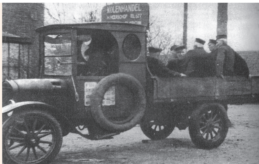
Erfgooiers op weg naar de vergadering

Als gevolg van de meentverbeteringen kon het maximum aantal vee door ieder scharend lid te weiden, langzamerhand van 7 op 16 stuks gebracht worden. Het vee vindt gemiddeld drie weken eerder dan voorheen goede weidegelegenheid en bij een normalen zomer, tot laat in den herfst, voldoende voedsel. Hiertegenover staat, dat wegens de zoo sterk gewijzigde economische omstan-