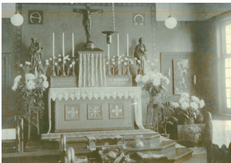
De kapel in het Olavshuis, het voormalige atelier van Veth aan de Parklaan 35

Veth verhuisde in mei 1924 naar Amsterdam, waar hij vooral naar rust verlangde. Hij had zijn hoogleraarschap opgezegd, dat hem niet bevredigde. Op 1 juli 1925 overleed hij na een zware galsteenoperatie. Zijn laatste publicatie was een klein boekje Rembrandt (1924). In 1987 stelde achterkleindochter Fusien Bijl de Vroe De schilder Jan Veth (1864-1925), chroniqueur van een bewogen tijdperk samen.