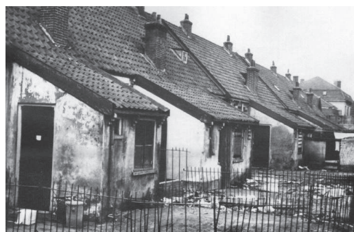
De krotwoningen aan de Veldweg