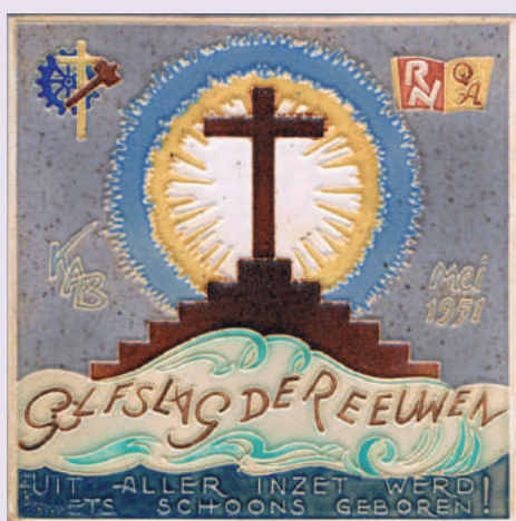
Tegeltje ter herinnering aan de opvoering van Golfslag der Eeuwen

moeder vertellen dat hij nog geen huur kon betalen. Hij kon dan uren over kunst blijven praten, tot ongenoegen van mijn nijvere moeder, die aan haar huishouden dacht. Praktisch ingesteld als zij was, drong zij er bij Pijpers op aan weer aan het werk te gaan: met praten kon je geen geld verdienen, vond ze. Maar de kunstenaar klaagde dat hij niet in de juiste 'sfeer' was om te werken. Dat voor die tijd nogal moderne woord sfeer ontlokte aan mijn moeder de opmerking dat zij heel goed kon afstoffen zonder sfeer.”