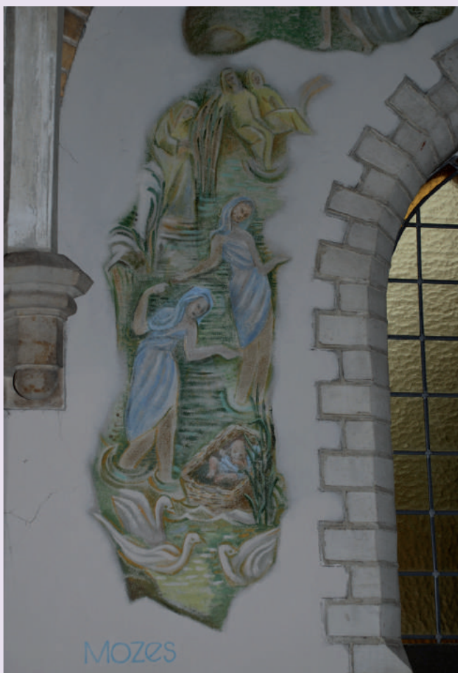
De dochter van de Farao vindt Mozes in zijn biesen mandje, Doopkapel St. Vituskerk