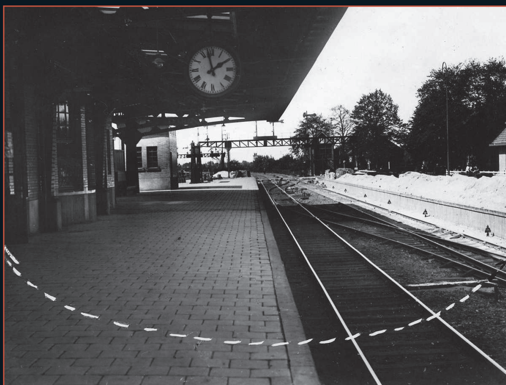
Vluchtroute uit de Wachtkamer der Derde Klasse

kende man met een revolver in de hand de wachtruimte binnenkomt. De mannen kijken elkaar aan en realiseren zich dat het goed mis is als de onbekende hen met schelle stem sommeert de handen in de lucht te steken en in de hoek van de wachtruimte plaats te nemen. De overvaller loopt, met het wapen op de hevig geschrokken mannen gericht, in de richting van de geldkist waaruit hij een grote greep doet. Tijdens zijn vlucht naar buiten