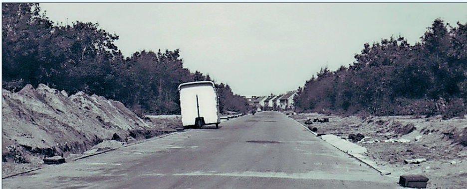
De toekomstige Anne Franklaan in 1960. Archief Gemeente Bussum.sestraatweg

Deel van het uitbreidingsplan Bussum Zuid 1958. Rechtsboven De Gooise Warande en de 5 flats aan de Leeuweriklaan, onder de Kolonel Palmkazerne en rechtsonder het niet-gerealiseerde woonwijkje aan de Amersfoortsestraatweg ("gaardes"). Archief Gemeente Bussum.