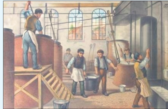
Schoolplaat De Zeepzieder

De gemeente ging akkoord, maar stelde aan de fabriek strenge voorwaarden. Desgevraagd meldde Portman: '... dat om aan alle gevaar van brand te voorkoomen, het Stookgat en de vuurgangen onder den ketel in de grond zijn gemetseld en de Schoorsteen, geheel vrij, van alle aanraking agter het foornuis waarin de Zeepketel gemetseld is dertig voet hoog opgaat, alvorens het dak te berei-