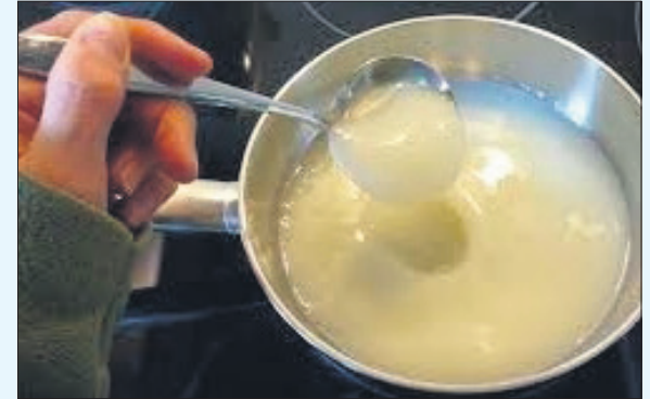
Zachte witte Spaansche zeep

ken, ...' (Notulen Gemeenteraad 8 Januari 1837)