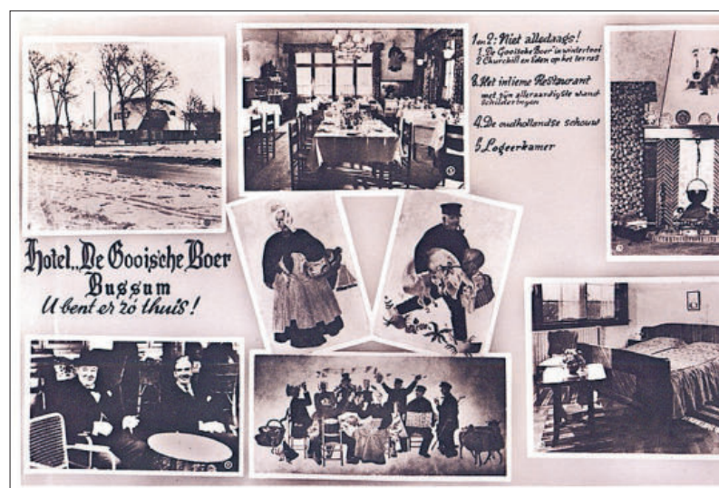
Een ansichtkaart uit de jaren vijftig

zijn minister van buitenlandse zaken Anthony Eden. Zij waren onderweg van paleis Het Loo, waar zij sinds de vorige avond bij koningin Wilhelmina te gast waren, naar Amsterdam. Het was een warme lentedag en Churchill, die zin had in een koud biertje, liet