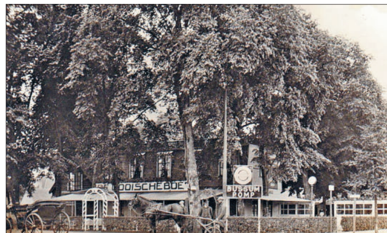
De Gooische Boer in 1930

Op 8 mei 1948 kreeg De Gooische Boer onverwachts twee beroemde gasten op zijn terras: de Engelse premier Winston Churchill en