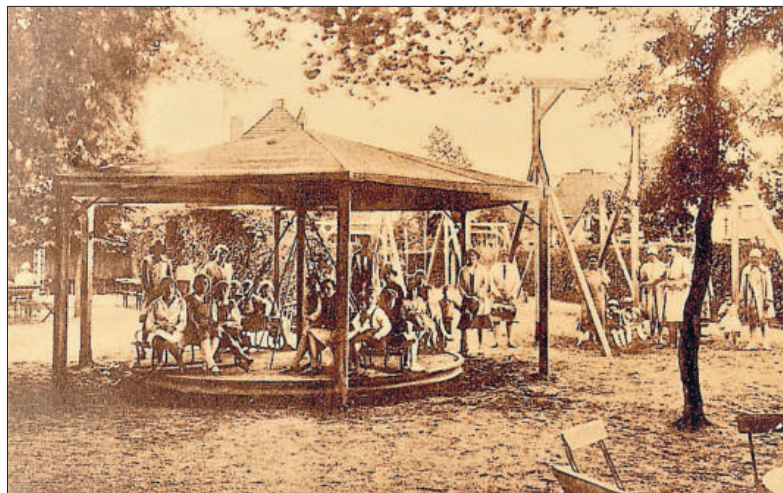
De speeltuin in 1930

FOTO EN TEKST: STREEKARCHIEF GOOISE MEREN