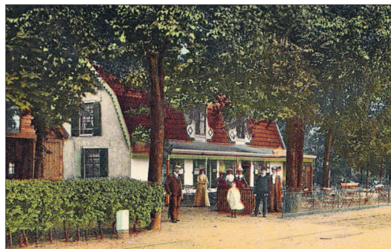
De Gooische Boer in 1905

Er kwamen talrijke bezoekers naar de uitspanning, waaronder grote groepen kinderen. Kelner Meyer, die vanaf 1910 aan het bedrijf verbonden was, vertelde in 1938: "Er stonden dan lange gedekte tafels onder de bomen en meer dan eens moesten er 2000 broodjes gesmeerd en belegd worden. Van Utrecht en Amsterdam kwamen ze met de vacantiëinderfeesten in drommen en in 4 dagen tijds waren er zoo een 1500 jeugdige bezoekers geweest. En dan de boerenbruiloften! Hoeveel optochten hebben er niet aangelegd, optochten van versierde sjeesjes, bestuurd door boeren met lange pijpen in den mond die de versierde zweep lustig lieten knallen. Ontelbare malen is hier het glaasje boerenjongens geleidigd op het geluk van het jonge echtpaar."