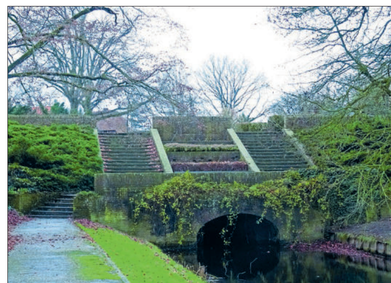
Trappartij in het Mouwtje.