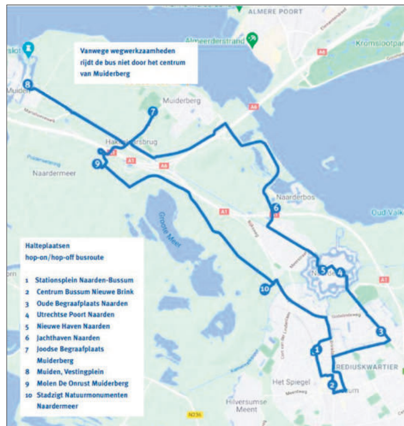
De route van de hop on – hop off-bus.