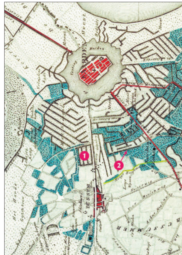
De zanderijsloten bezuiden Naarden, voor de aanleg van het Prins Hendrikpark (1) en het Brediuskwartier (2).