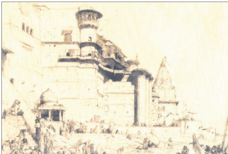
■ Benares (1899) droge naald ets.

er rest een wonderland van paleizen en tempels, bevolkt met onafzienbare rijen van bontgeklede oosterlingen, van rijkgetooide paardenstoeten, van kamelen en drommen olifanten. De herinnering verzacht de schaduwen en het licht, werpt een doorzichtige sluier over de werkelijkheid en verandert haar in een droombeeld waarvan de kleuren nooit zullen verflauwen'