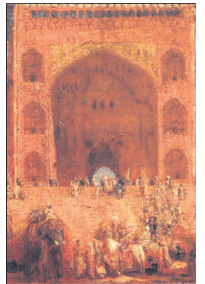
■ Ingang van een moskee in India (ca 1899) olieverb op mahonie paneel.

in een huis dat achter de kolonie Walden van Frederik van Eeden lag. Ze zouden er tot 1903 wonen. In 1897 zette hij voet aan wal in India. Bij deze reis vielen de uiteenlopende kanten van zijn kunstenaarschap – schilderen, aquarelleren, etsen en tekenen, maar ook schrijven en illustreren – op unieke wijze samen. Het