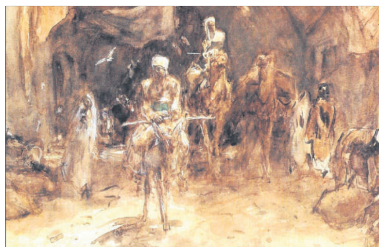
■ Bazar met ezel en kamelen in Damascus (ca 1911) aquarel.

FOTO EN TEKST: STREEKARCHIEF GOOISE MEREN