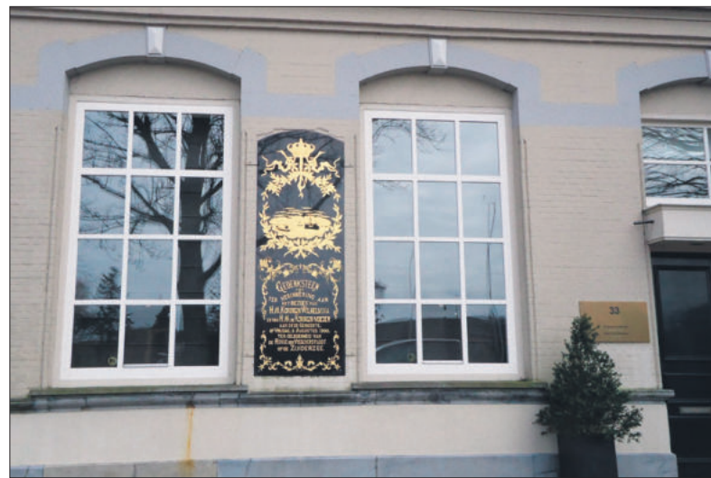
De gedenksteen in het pand Herengracht 33.

Daarna begon de vlootschouw, een schouwspel van ruim maar liefst 1600 vaartuigen. Het waren er in de vroege ochtend nog meer geweest, maar een flink aantal had moeten afhaken omdat gezinsleden van de vissers door de ruwe zee zeeziek waren geworden. Een kanonschot klonk als sein dat de zeilen konden worden gehesen en "het was het mooiste wat de Zuiderzee dien dag had te aanschouwen". Om half vijf namen de dames weer plaats in de prach-