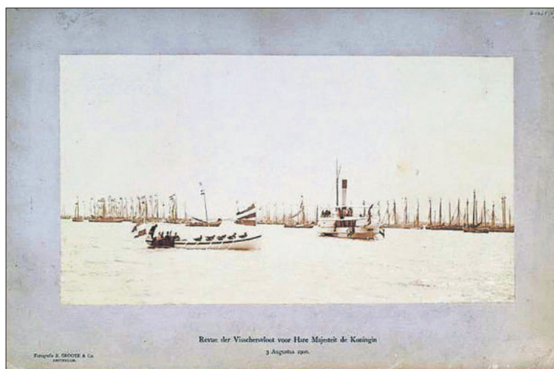
Gezelschap wordt aan boord gebracht.