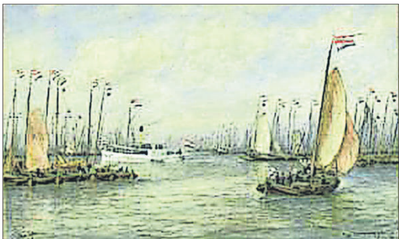
De vlootschouw (aquarel van C.C. Dommelshuizen; Scheepvaartmuseum).