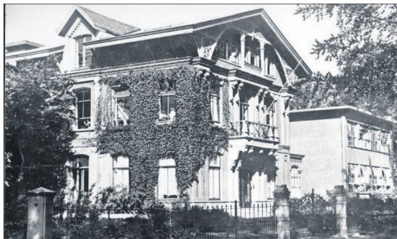
■ Het Lyceum in 1934.