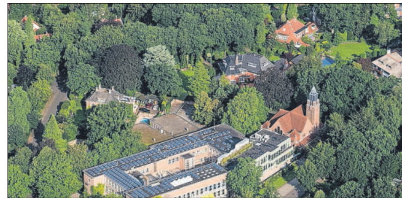
■ Het Willem nu, van bovenaf gezien.

door de architect E.J. Jurriëns ontworpen gebouw. Dit gebouw, waarin de bestaande lokalen geïntegreerd waren, staat er nog steeds. Bij de officiële opening van het nieuwe gebouw op 5 september