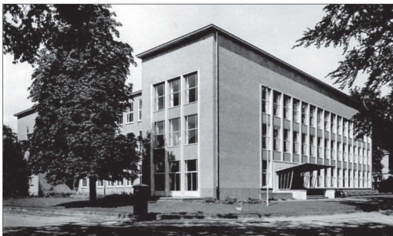
■ Het Lyceum in 1954.

In 1974 kreeg de school eindelijk een goede gymzaal die ook als aula dienst kon doen. Vanaf dat jaar huurde de school ook de villa Oldeterp die achter de school ligt. Er werden een bibliotheek en een paar kleine lokalen in gecreëerd.