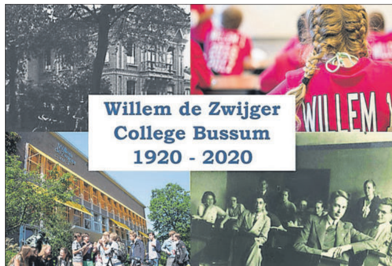
■ Het jubileumboek.

FOTO EN TEKST: STREEKARCHIEF GOOISE MEREN