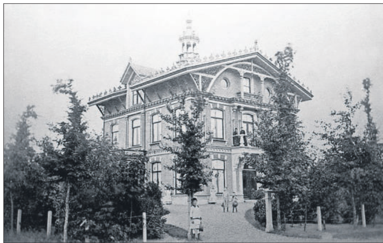
■ De villa Nieuwburg rond 1900.

In 1923 werden er ook jongens toegelaten. Met de Gooische HBS, die al sinds 1911 bestond, werden goede afspraken gemaakt over de inhoud van de lessen in klas 1 en 2, opdat de getalenteerde leerlingen gemakkelijk over konden stappen naar de gymnasiumafdeling van het lyceum. Er kwam een gemeenschappelijk toelatingsexamen en