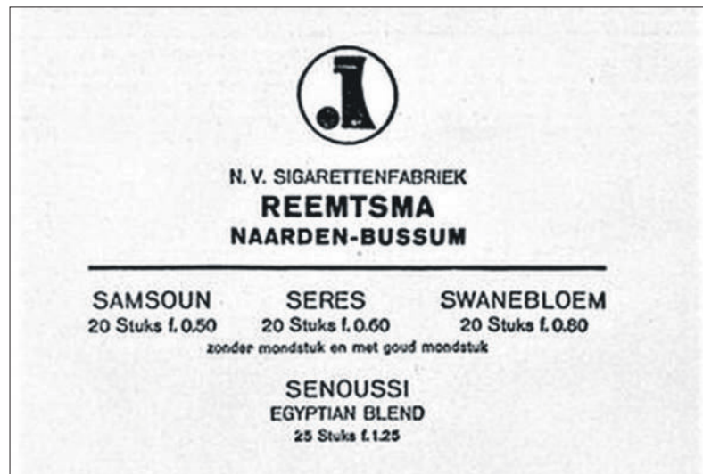
■ Advertentie van Reemtsma in 1925.