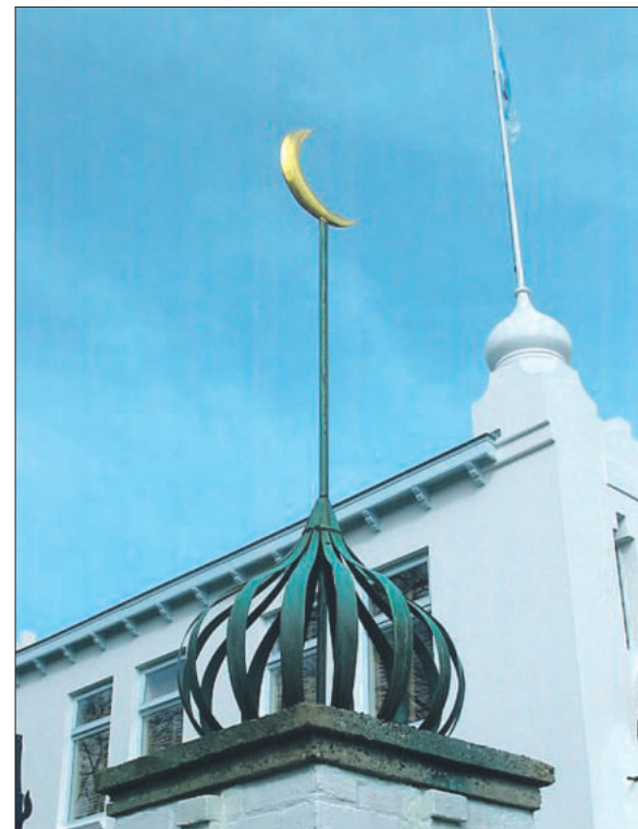
■ Oosterse elementen