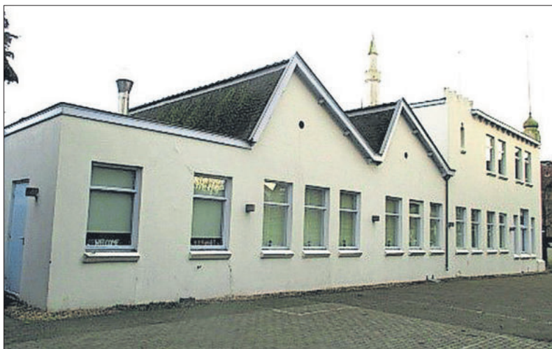
■ Het zaagtanddak aan de achterkant van het gebouw

Sigarettenfabriek in Naarden in: E. de Paepe e.a., Het Gooi toen & nu, Zwolle 2010, Gooise Meren - Informatie, Rijksmonumenten.nl en diverse kranten