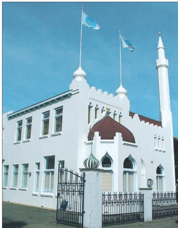
■ 'Palazzo' in de Comeniuslaan

In februari 1918 werden bij een inbraak in de fabriek 18000 sigaretten meegenomen. Nadien bleven er flinke hoeveelheden sigaretten verdwijnen, die in Amsterdam op de markt bleken te komen onder een fabrieksmerk, dat nog niet door de fabriek in de handel was gebracht. Er werd aangifte ge-