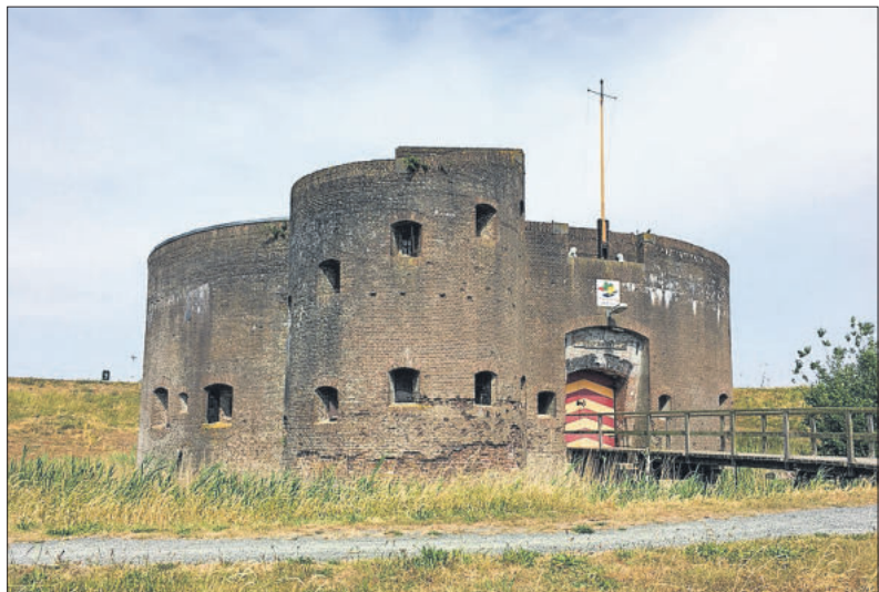
■ Westbatterij mei 2020.

H.P. Moelker: van Schans tot Westbatterij. Uitgave HKSM 2004.