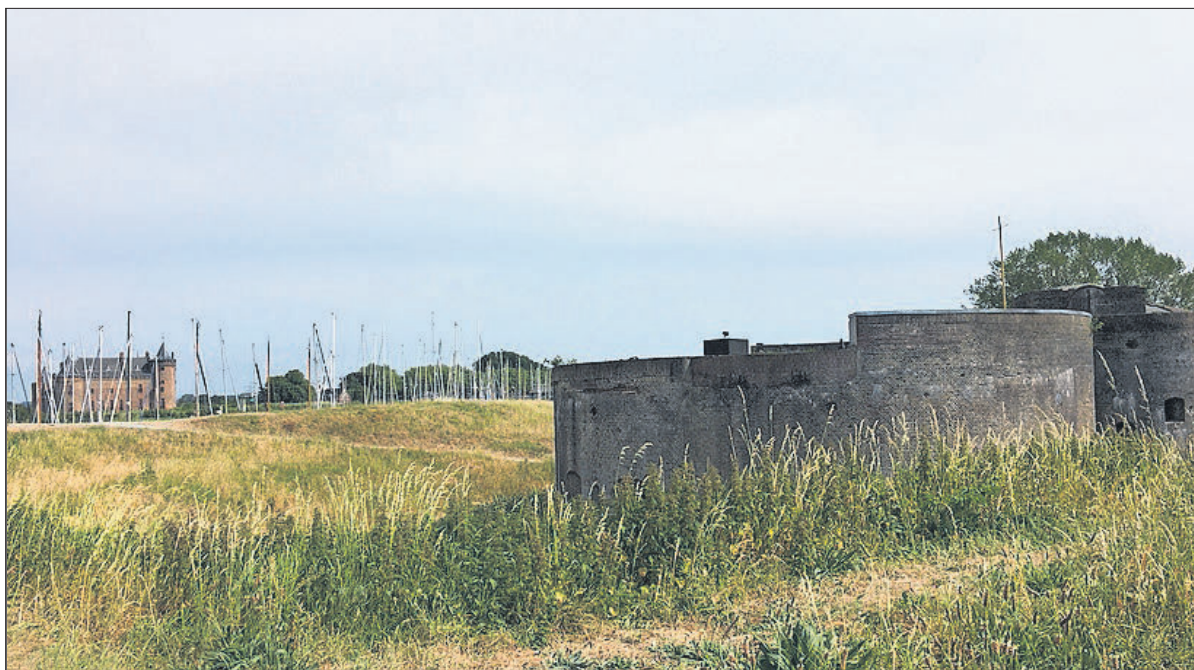
■ Westbatterij en Muiderslot mei 2020.

In mei 1852 werd de aanbestedingsakte getekend. Er werd in bepaald dat de Katersloot ter plaatse even breed en diep moest blijven en dat de veranderingen de vaart niet mochten belemmeren. Voorts werd bepaald "dat een goede rijweg door de Westbatterij door het rijk zal worden aangeemaakt en onderhouden, welke vrij zal mogen worden gebruikt door het Hoogheemraadschap, door alle pachters en huurders van de dijk of van in de nabijheid gelegen gronden". In 1854 werd de Vesting Muiden toegevoegd aan de Nieuwe Hollandse Water-