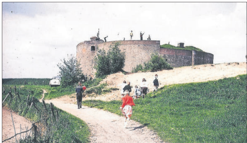
■ De zandspeelplaats bij het fort in 1965.