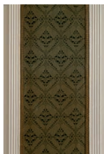
Detail van de wandbespanning in de hal