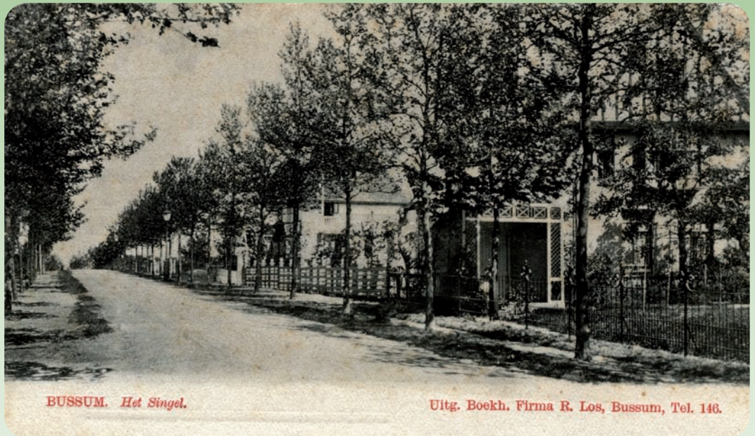
Singel 6 met prieel, aan de linkerkant is de straat nog onbebouwd